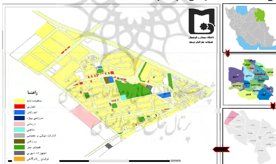
شکل ۱: موقعیت محله در کشور، استان، شهر و منطقه

در برنامه‌ریزی و طراحی این مجموعه‌های مسکونی، رعایت اصول و معیارهای کیفیت زندگی در ارزیابی مثبت شهروندان از کیفیت محیط زندگی آنان کمتر مورد توجه قرار گرفته است. پیامد نامطلوب این کم‌توجهی، شکل‌گیری ساختمان‌های بی‌روح بدون روابط اجتماعی خودانگیخته بوده و به تبع میزان مشارکت و اعتماد بین ساکنان کاهش یافته و در نتیجه افراد ساکن در این‌گونه مجموعه‌های مسکونی ارزیابی مثبتی نسبت به کیفیت زندگی خود ندارند