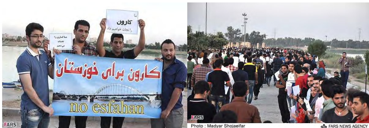
شکل ۳. اعتراض مردم استان خوزستان در انتقال آب کارون به استان اصفهان

انتقال آب این استان به اصفهان از طریق تونل بهشت‌آباد اعلام کردند (شکل ۴) (سایت خبری تحلیلی الف، ۱۳۹۳/۱/۲۸).