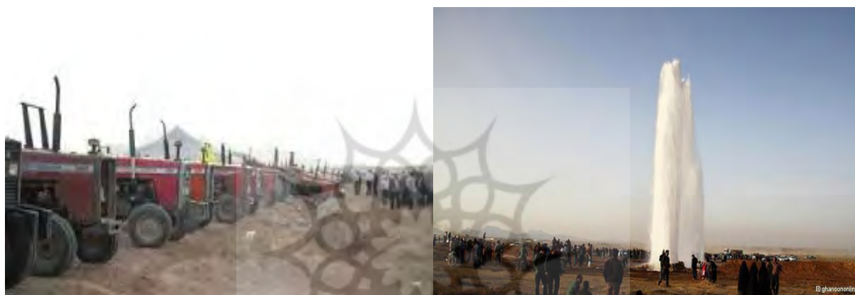
شکل ۲. اعتراض کشاورزان شرق استان اصفهان و قطع لوله انتقال آب استان یزد به‌دست کشاورزان

و مشکلات زیادی برای مردم به‌وجود آوردند که در نتیجه باعث قطعی و جیره‌بندی آب در ۱۳ شهر استان یزد شد (شکل ۲). در مقابل مسئولان یزد، استان اصفهان را با قطع سنگ آهن مجتمع ذوب آهن اصفهان تهدید کردند که از یزد تأمین می‌شود. البته پیشینه و زمینه این درگیری به شهریورماه ۱۳۹۰ برمی‌گردد که آب زاینده‌رود برای کشاورزان شرق استان اصفهان جاری شد، ولی از تیرماه ۱۳۹۱ همان‌طور که پیش‌بینی