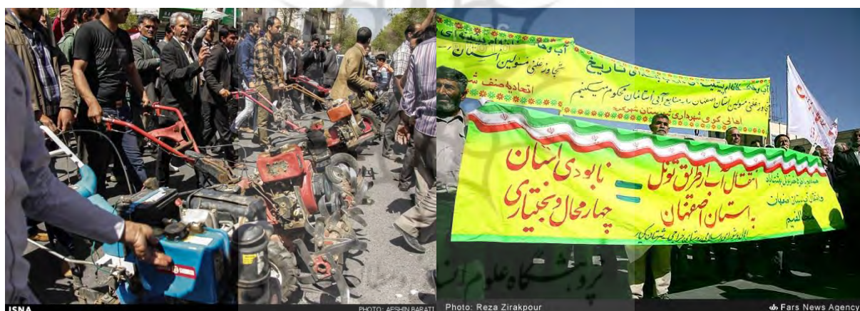
شکل ۴. اعتراض مردم چهارمحال و بختیاری در انتقال آب کارون به استان اصفهان

پس از اعتراض مردم خوزستان به انتقال آب اصفهان، مردم چهارمحال و بختیاری در ۲۸ فروردین ۱۳۹۳ با تجمع مقابل استانداری، اعتراض خود را به