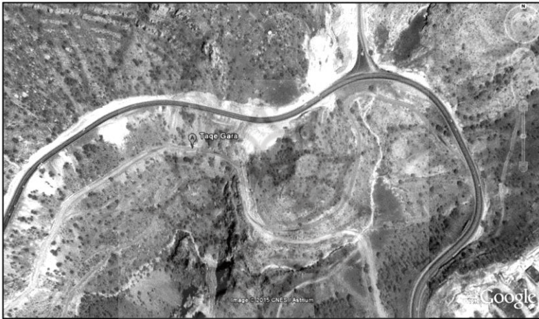
تصویر ۱. تصویر هوایی طاق گرا را در گردنه طاق گرا یا عقبه خلوان

رخدادهایی می‌توانست مانع از حضور زائران در عتبات عالیات گردد؛ به گونه‌ای که در سال ۱۲۹۴ هـ.ق به واسطه وقوع بیماری وبا در عراق، دولت قاجار مسافرت زائران ایرانی به عراق را ممنوع کرد و در مقابل، آنان را تشویق به زیارت امام هشتم در مشهدالرضا نمود (Litvak, 2001: 33).