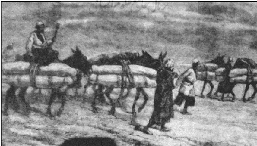
تصویر ۴. کاروان اموات در مسیر عتبات عالیات به روایت دیولافوا (دیولافوا، ۱۳۸۵: ۲۱۴).