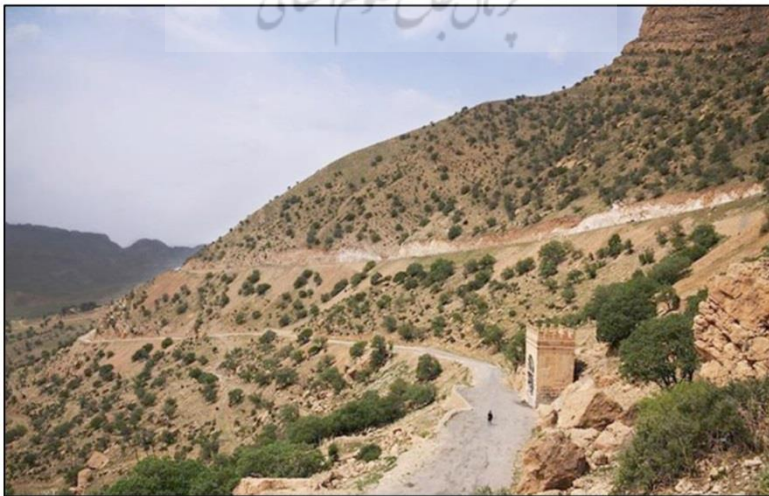
تصویر ۲. طاق گرا واقع در گردنه طاق گرا