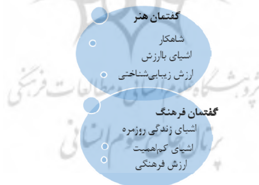
شکل ۲. رویارویی گفتمان هنر و گفتمان مواد فرهنگی در موزه‌های هنر اسلامی (نگارنده)

و مجسمه و در مرحله بعد بر «هنرهای فرعی» تری چون سرامیک، آثار فلزی یا شیشه تمرکز می‌کنند. در مقابل، موزه‌های «مواد فرهنگی» به نمایش «فرهنگ» بیش از «هنر» متمایل هستند. در این موزه‌ها به بافت شیء توجهی بیش از خود شیء نشان داده می‌شود. مواد فرهنگی دربرگیرنده مقولاتی چون «مذهب»، «جغرافیا» و مفاهیم فرهنگی چون «زندگی خانوادگی» هستند. ۱ گونلا با وجود نابرابری‌های توصیفی و طبقه‌بندی‌های سنتی هنر در قرن نوزدهم، عنوان «هنر» را برای آثار اسلامی موجود در موزه‌ها مناسب‌تر از «فرهنگ مادی» می‌داند. به عقیده او، طی صد سال گذشته پیشرفت‌های وسیعی در حوزه هنر اسلامی در سطح جهان ایجاد شده و موزه‌های هنر در مقایسه با فرهنگ مادی توانسته‌اند بستری منعطف‌تر و بدون جهت‌گیری برای پل زدن بر شکاف‌ها ایجاد کنند و افزون بر آن خوانش‌های متفاوت از آثار اسلامی را امکان‌پذیر سازند. امروزه با توجه به تغییر مداوم معنای هنر و درک ما از آن، کفایت تمرکز بر صورت و فرم آثار هنری و تکیه بر ارزش‌های جهان‌شمولی چون زیبایی و هارمونی در معرفی هنر اسلامی، از سوی پژوهشگرانی چون ترولنبرگ و وبر زیر سؤال رفته است. ۲