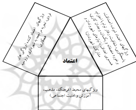
شکل شماره ۲. مدل سه بعدی

ارتباطات و تأثیرهای این متغیرها در مدل پیشنهادی ابتدایی در سه مؤلفه‌ی ویژگی‌های اعتماد کننده، ویژگی‌های اعتماد شونده، اعتماد شهری و ویژگی‌های محیط، طراحی شده‌اند. بنا براین مدل سه بعدی به صورت زیر پیش‌بینی شده است: