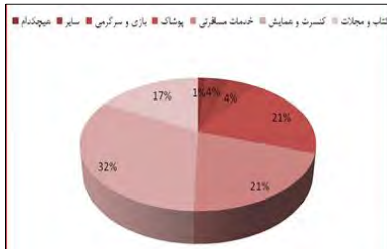
نمودار ۳. درصد فراوانی هر یک از پاسخ ها برای متغیر علاقمندی به انواع پیامک های تبلیغاتی