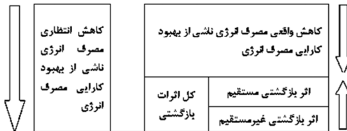
شکل (۱). تقسیم‌بندی اثرات بازگشتی