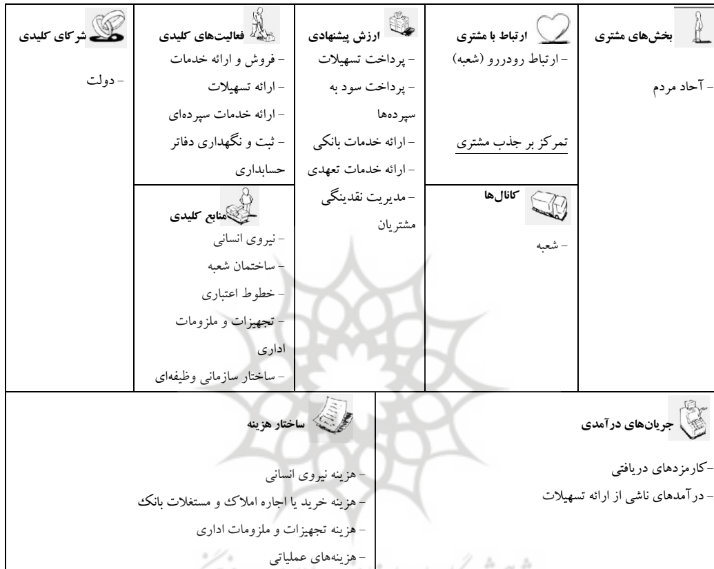
جدول ۱۱. مدل کسب و کار گذشته بانک