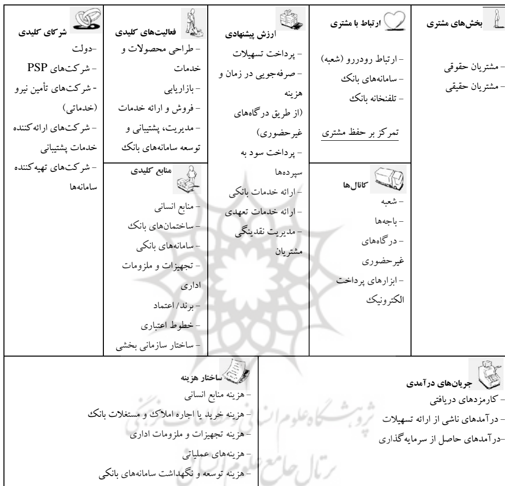
جدول ۱۲. مدل کسب‌وکار موجود بانک