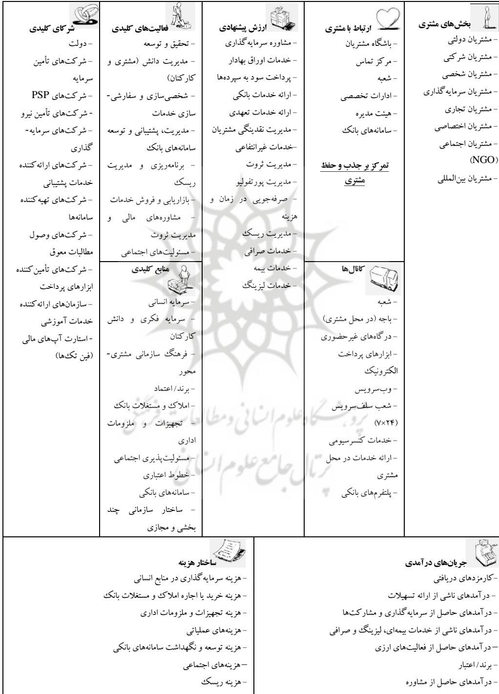
جدول ۱۳. مدل کسب و کار آتی بانک