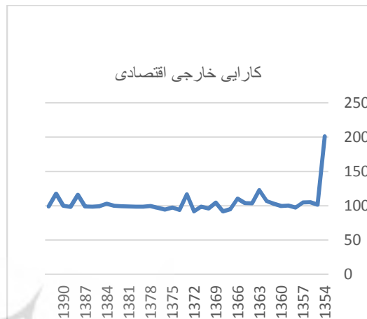
نمودار ۱. روند کارایی خارجی اقتصادی آموزش

کارایی سیستم را ارتقاء می‌بخشد. نتایج میزان کارایی خارجی در دو حوزه اقتصادی و اجتماعی و کلی در نمودارهای شماره ۱ تا ۳ آمده است.