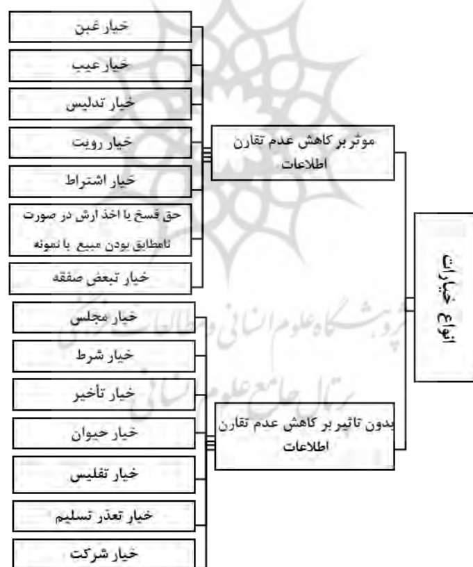
شکل ۱: تأثیر خيارات بر کاهش عدم تقارن اطلاعات در بازار

- خيار تعدر تسليم: به معنی این است که فروشنده نتواند کالایی را که فروخته تحویل دهد؛ مثلاً اسبی را که فروخته فرار نماید که در این صورت مشتری می‌تواند معامله را به هم بزند (شهید ثانی، ۱۹۹۲م، ج ۳، ص ۵۰۹-۵۱۰). - خيار تفليس: عبارت است از تسلط طلبکار بر فسخ معامله به سبب یافتن عین مال خود در اموال مفلس (همان، ج ۲۵، ص ۲۹۵-۲۹۶). در شکل زیر به صورت خلاصه، تأثیر خيارات بر کاهش عدم تقارن اطلاعات نشان داده شده است.