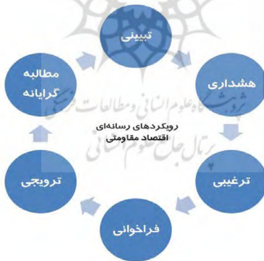
شکل ۲. رویکردهای رسانه‌ای اقتصاد مقاومتی

ه) رویکرد هشدار: بعد مهم گفتمان اقتصاد مقاومتی، «وجه هشدار» آن است. براساس این رویکرد، رسانه‌ها برای ساخت گفتمان اقتصاد مقاومتی نباید از رویکرد هشدار نسبت به اهمال یا انحراف از خطوط اصلی ترسیم شده از سوی مجریان و مباشران غفلت کنند. عدم تحقق پیگیری بندها و اهداف اقتصاد مقاومتی می‌تواند دارای تبعات متعددی باشد، به‌ویژه در شرایط کنونی که اقتصاد مقاومتی هنوز در جامعه ایرانی به گفتمانی فراگیر تبدیل نشده است.