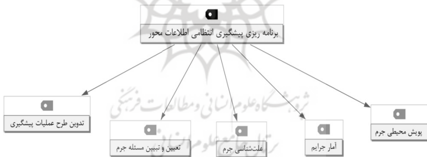
نمودار ۱: شبکه مضامین اصلی شاخص‌های برنامه‌ریزی پیشگیری انتظامی اطلاعات‌محور

همانطور که نمودار ۱ نشان می‌دهد، شاخص‌های برنامه‌ریزی پیشگیری انتظامی اطلاعات‌محور در قالب ۵ مضمون اصلی شناسایی شد که در ادامه مضامین فرعی آورده شده است: