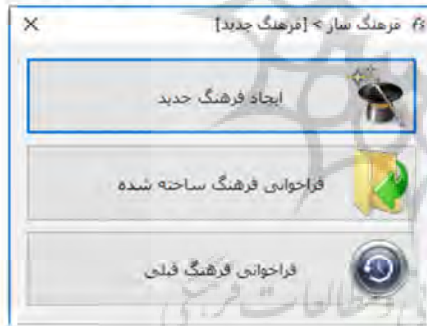
شکل ۱: پنجره ورود به برنامه

در آغاز باید نرم‌افزار فرهنگ‌نویسی هم‌صدا را از وبگاه www.ham3da.ir بارگیری و بر روی رایانه خود نصب کرد. سپس باید از دستکاپ خود Dictionary Maker را اجرا کرد تا پنجره اولیه «فرهنگ‌ساز» فرهنگ جدید» نمایش داده شود (شکل ۱).