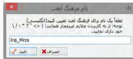
شکل ۲: پنجره وارد کردن نام

پس از فشردن کلید «ایجاد فرهنگ جدید» یک پنجره نمایش داده می‌شود (شکل ۲) که از کاربر می‌خواهد یک نام برای ذخیره فرهنگ بر روی دیسک سخت وارد کند. پس از وارد کردن نام در کادر مربوط و تأیید آن، «فرهنگ جدید» در پوشه پیش فرض Documents\Fs2 ذخیره می‌شود. پنجره ورود نام بسته و صفحه اصلی برنامه نمایان می‌شود.