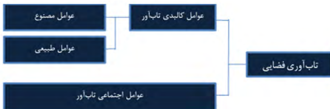
تصویر ۲. مدل تاب‌آوری فضایی.

از آنجاکه فضاهای شهری مشتمل بر دو بعد کلی کالبدی و اجتماع هستند و اختلال در دو بعد مذکور سبب اختلال در تاب‌آوری فضاهای شهری می شود، لذا به منظور بررسی عوامل مؤثر بر تاب‌آوری هر فضای شهری و تدوین مدل مرتبط با آن، لازم است عوامل مؤثر در این دو مؤلفه بررسی شوند. مدل نهایی تحقیق براساس این پیش‌مدل اولیه قابل حصول خواهد شد (تصویر ۲).