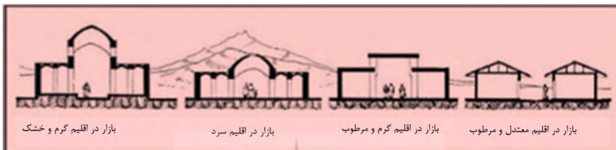
تصویر ۳. نقش اقلیم در فرم بازار. مأخذ: قبادیان، ۱۳۷۷: ۱۸۳.

فرهنگی، اجتماعی، مذهبی و ... جایگاه ویژه‌ای در میان فضاهای شهری دارد (تصویر ۴). این بازار از اجزا و عناصر متعددی تشکیل می‌شود و در طراحی آن به گونه‌ای ماهرانه فضاهای تجاری و اداری را با امکان فرهنگی در کنار هم قرار داده‌اند (جدول ۱). راسته‌های این بازار دارای طاق‌های بلند (مطابق با فرم بازار در اقلیم گرم