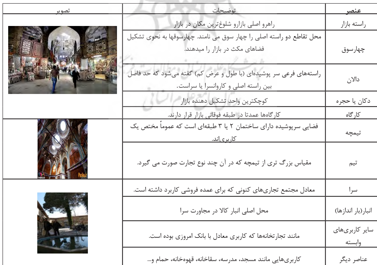
جدول ۱. عناصر اصلی تشکیل دهنده ساختار فضایی بازار قیصریه اصفهان.