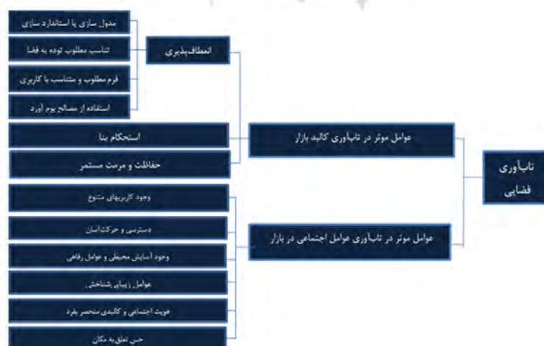
تصویر ۶. مدل تاب‌آوری فضایی مرتبط با بازار قیصریه اصفهان.

از جنبه اجتماعی؛ ۱. وجود کاربری‌های متنوع از طریق فرم انعطاف‌پذیر و همه‌شمول بودن فضا جهت تناسب با نیازهای معاصر وقت، درهم‌تنیدگی فضاهای فرهنگی و اقتصادی در فضا که موجب تسهیل عملکرد کاربری‌های امروزی در کالبد دیروزی (یا امروزی‌شده) می‌شود. ۲. امکان دسترسی و حرکت از این فضا به کاربری‌ها و کاربرد خود راسته بازار که راه ارتباطی است. ۳. وجود آسایش محیطی در این فضا که به‌موجب هوای مطبوع و به‌دور از آلودگی (هوا/ صوتی) ناشی از خرده اقلیم ایجاد شده در این فضا و سایر تسهیلات موجود در این فضا است. ۴. توجه به عوامل زیبایی‌شناختی در طراحی بازار که عاملی انگیزشی در جهت تداوم فعالیت در بازار است. ۵. هویت منحصربه‌فرد بازار که به سبب ارزش‌های تاریخی، فرهنگی و اجتماعی موجود حاصل شده است. ۶. حس تعلق خاطر و دلبستگی مراجعان به مکان، سبب استمرار در استفاده از این فضا و متعاقباً تاب‌آوری فضایی این بازار تاریخی شده است.