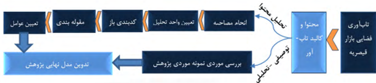
تصویر ۱. فرایند تحقیق.

در اجلاس سال ۲۰۰۵ گوتنبرگ سوئد برای تاب آوری چهار بعد کلی اجتماعی، اقتصادی، کالبدی و زیست محیطی در نظر گرفته شد (resilience alliance, 2007:17) لیکن در حال حاضر برای تاب آوری ابعاد گوناگون دیگری چون فضایی، معیشتی، فرهنگی و... نیز لحاظ شده است. چندین دهه پس از معرفی مفهوم تاب آوری، ایده تاب آوری فضایی مطرح شد (Cumming, 2011: 901). اولین بار تاب آوری فضایی در پژوهش نیستروم و فولک تحت عنوان تاب آوری فضایی و بادبان های قرمز (۲۰۰۱) مورد سؤال قرار گرفت (Nystrom & Folke, 2001:407). کامینگ (۲۰۱۱) در تعریف تاب آوری فضایی می نویسد تاب آوری فضایی بیشتر تاب آوری یک مکان است تا یک واحد خاص مورد علاقه (Cumming, 2011: 901).