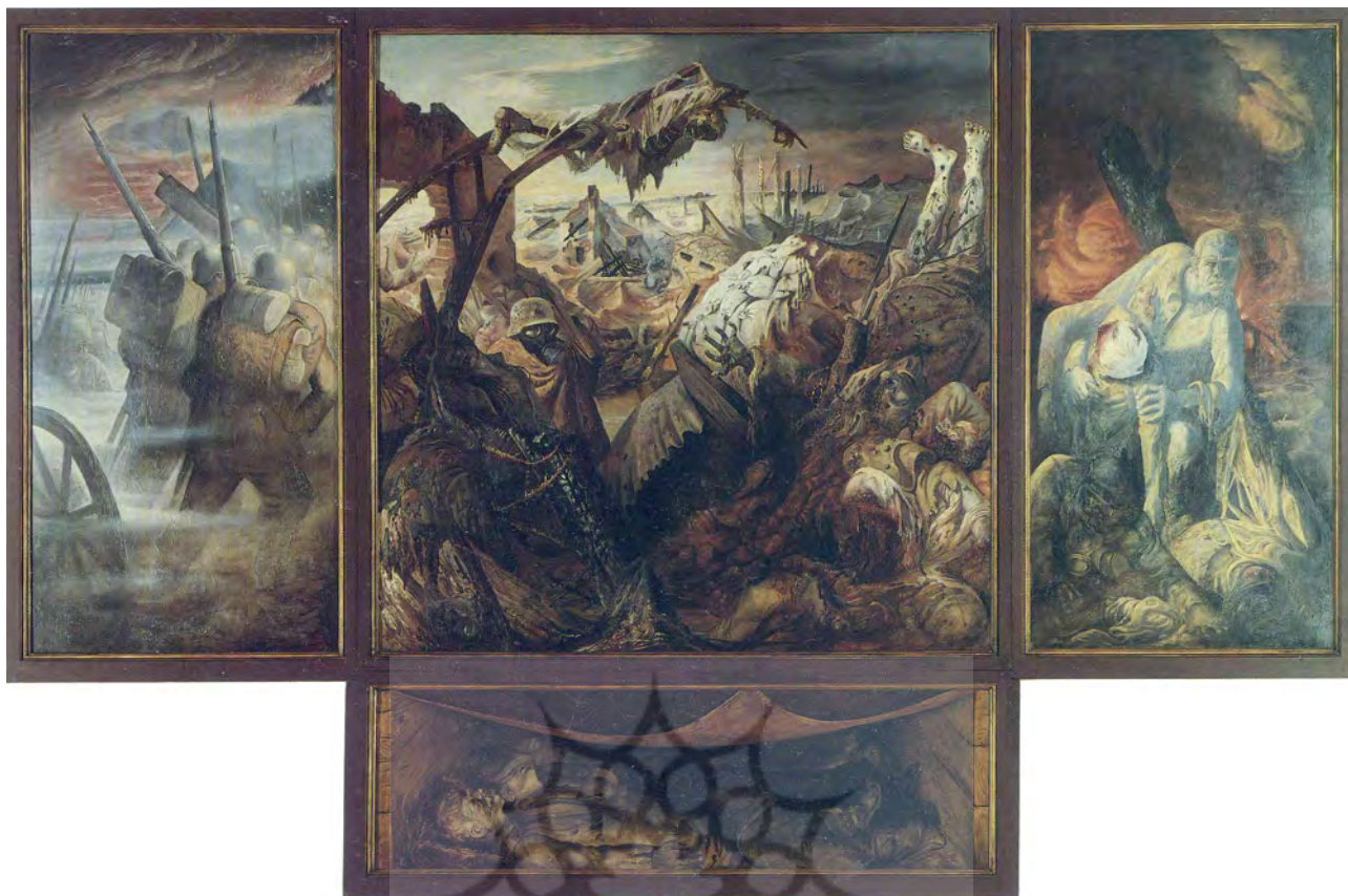
تصویر ۲. جنگ - اتو دیکس - ۱۹۲۹-۱۹۳۲. لته میانی ۲۰۴*۲۰۴ سانتیمتر - لته‌های جانبی ۱۰۲*۲۰۴ سانتیمتر. تمپرا روی چوب - گالری نقاشی نویهمایستر - درسدن.