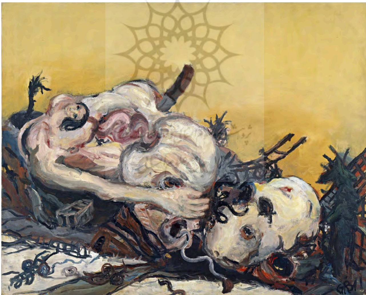
تصویر ۴. تصویری برای پدرها - گئورگ بازلیتس - ۱۹۶۵. ۵۰*۶۵ سانتیمتر. رنگ‌روغن روی بوم - موزه مدرن استکهلم.

۱۹۶۰ و ۱۹۷۰ بازلیتس مناظر زادگاه‌اش که در مزارع آن کودکی‌اش را سپری کرده بود، زادگاهی که بعد از جنگ ویران شده و او بعدها به اجبار ترک‌اش کرده بود، به تکرار ظاهر می‌شدند. در این سال‌ها او مجموعه‌های قهرمان‌ها ۵۴ ، شورشی‌ها ۵۵ ، و نوع جدید ۵۶ را کشید که همگی مردانی را با لباس‌های پاره و در میان مناظری متروک و ویران تصویر می‌کردند؛ نمادهایی همچون تله، صلیب، جانوران، اندام‌های مثله‌شده و غیره در این آثار حضوری دائمی داشتند. این ژنده‌پوش‌ها بر خلاف عنوان‌شان، نه قهرمان که ضدقهرمان به نظر می‌رسند؛ شورشی‌ها و قهرمان‌هایی که در میانه مناظر ویران نه ابزاری برای پیروزی دارند و نه با اندام‌هایی که یا در تله یا زخمی‌اند، امیدی به امکان اصلاح شرایط از آنها می‌رود. آنها گاه زخمی و پابرنه‌اند، اغلب کوله‌بار سنگینی بر دوش دارند و پشت سرشان خانه‌هایی در حال سوختن یا مناظری سوخته دیده می‌شود. این مردان را هم می‌توان نماد کهنه