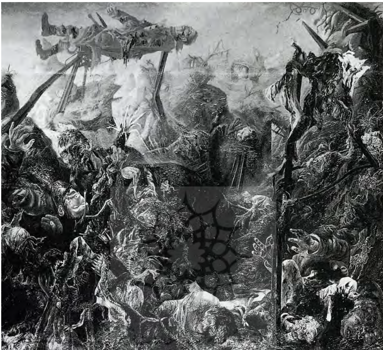
تصویر ۳. خاکریز - اتو دیکس - ۱۹۲۳-۱۹۲۰. ۲۵۰*۲۵۰ سانتیمتر. رنگ روغن روی چوب - محل نگهداری نامعلوم.

رویکردی خودزندگی‌نگارانه ۴۷ تلقی کرد؛ که در عین حال روایت هر کهنه سربازی از میدان جنگ هم می‌تواند باشد. مجموعه چاپی جنگ ۴۸ که او در ۱۹۲۴ بر مبنای طراحی‌هایش از جبهه جنگ خلق کرد، هم شرح‌حال تصویری او از سال‌های خط مقدم جبهه جنگ است، و هم ۵۰ تصویر مستند با رویکردی پسااکسپرسیونیستی ۴۹ که سوپه غیرقهرمان‌گرایانه جنگ، و زخم همچنان دردناک روان‌زخم یک شاهد عینی را مقابل مخاطب قرار می‌دهد. در آلمان بین دو جنگ آثار مبتنی بر تجربیات دست اول این هنرمند از میدان جنگ، به مثابه صحنه‌ای بود که مخاطب را به درون خویش می‌کشید و با ارجاع به حافظه جمعی‌ای که از تصاویر جنگ و روایات