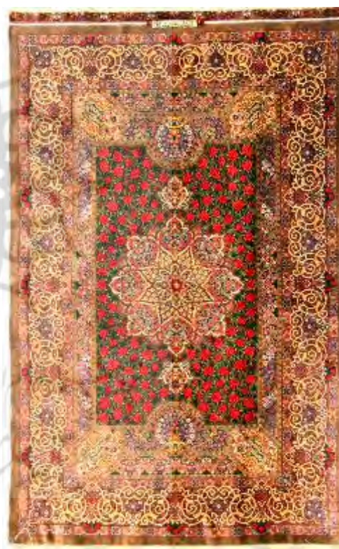
تصویر ۳: فرش ترنجی کتیبه دار

نظرات فوق نشان می‌دهد به طور عمومی فرش قم در زمره قالی‌های محبوب و مورد پسند جامعه است و دریافت نمره بالا در نظرسنجی تأییدی بر این ادعا است. این دلایل چنان که در پاسخ‌ها آشکار است، به عوامل طرح و رنگ وابسته است که سبب زیبایی ظاهری در فرش این منطقه می‌شود.