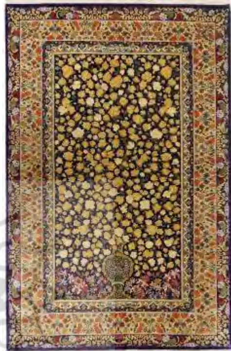
تصویر ۴: طرح گلدانی گل فرنگ قم

مختلف طرح کلی را سامان می‌دهد. این تکرار خود به نحوی باعث تأکید است؛ تأکیدی که می‌تواند ذهن مخاطب را با زیبایی درونی قالی و دلیل وجودی اثر هنرمند گره بزند و در یک مکاشفه شخصی به زیبایی اصیل هنر برساند. در بین این عوامل تکرار و تقلید مهم‌ترین شاخصه زیبایی شناسی قالی‌های قم است که تکراری همواره با نوآوری بوده است.