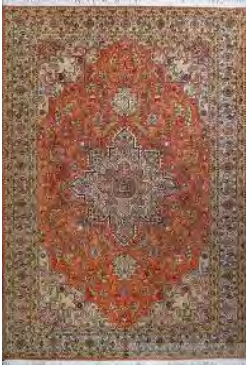
تصویر ۱: فرش لچک و ترنج شکسته قم

طرح و نقش مستقل ندارند و به دیگر نواحی وابسته است. با وجود این، طراحی دقیق و بی نقص سبب شده تا قالی قم سبک خاص خود را داشته باشد» (اشنبرنر، ۱۳۸۴: ۷۶). کاربرد نقوش سایر مناطق، وجود طراحان و نقاشان زبردست عاملی شد تا قم از بهترین و مخاطب پسندترین طرح‌ها و نقشه‌های قالی ایران بهره گیرد. این مسأله به ادامه حیات و اوج گیری قالی قم کمک شایانی کرد.