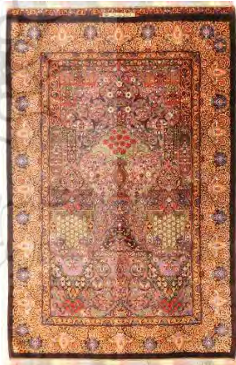
تصویر ۶: قالی گلدانی

فرش‌های بدون جهت یا خنثی از هر سو که بدان نظر کنیم، تفاوتی نمی‌کند و کاربرد آن عمومی‌تر است.» (حاج محمدحسینی و آیت‌اللهی، ۱۳۸۴، ۷۶) رعایت تناسب رایج در قالیبافی و استفاده از نقش متناسب با طرح‌ها و اسکلت کلی، قالی قم را به عنوان عنصری مشخص در زیبایی‌شناسی معرفی می‌کند که تمام سعی و تلاش هنرمند طراح و رنگ‌بند در راستای آن شکل می‌گیرد. بررسی آماری نمونه‌های مورد مطالعه نشان می‌دهد نیمی از قالی‌های قم با طرح جهت دار و ۵۰ درصد آن با طرح کلی مرکزی و بدون جهت است. فراوانی طرح‌های جهت‌دار در قالی‌های قم شاید نشان از توجه دیرینه این شهر مذهبی ایران به بافته‌های سجاده‌ای دارد که در این صورت رگه‌هایی از تأثیرات زیبایی‌شناسی مذهبی در آن‌ها مشهود است. اگر چه این ارتباط به طور قطعی اثبات‌پذیر نیست. مخصوصاً با توجه به اینکه امروزه درصد زیادی از این قالی‌ها روانه کشورهای خارجی می‌شود و مصرف داخلی بسیار ناچیزی دارد.