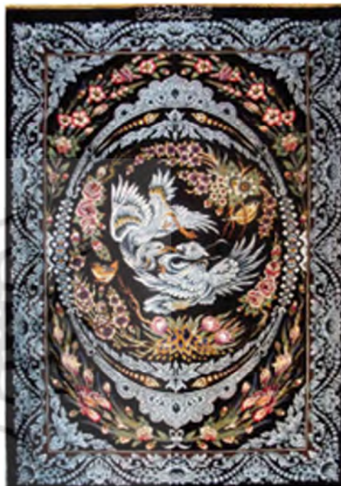
تصویر ۲: فرش تصویری قم