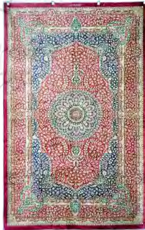
تصویر ۵: لچک و ترنج ریز گل

بر اساس نظریاتی که در باب زیبایی مطرح شده است، نگریستن به صورت (فرم) شی، اهمیتی ویژه دارد. در حقیقت نخستین عاملی که در یک اثر هنری ظاهر می‌شود و پس از ژرف شدن، باطن است که خویشتن را هویدا کرده و تأویل‌هایی را ایجاد می‌کند. هر اثر هنری، از جمله قالی، دارای ویژگی‌های ظاهری است. این خصوصیات صوری، لایه زیرین دیگری دارد که ویژگی‌های درونی آن اثر را شکل می‌دهد و مخاطب تنها با اندیشه و تأمل است که می‌تواند به آن‌ها دست یابد. در قالی، ویژگی‌های ظاهری شامل اندازه، طرح، نقش، رنگ، بافت و... است. ویژگی‌های درونی و باطنی فرش نیز در برگیرنده خصوصیات و جهت‌گیری‌های جامعه‌شناختی، مذهبی، اقتصادی، تأثیر بیگانگان، سلیقه سفارش‌دهندگان و در نهایت نقش خود طراح و بافنده به عنوان آفرینش‌گر و هنرمندی که حالات روحی‌اش در شکل‌گیری و زیبایی فرش مؤثر است. بنابراین، عوامل زیباشناسانه در قالی عبارت هستند از (دریایی، ۱۳۸۷: ۵۲):