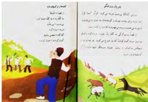
تصویر ۹: چوپان دروغگو

ایرانی است که با حس نوستالژی قوی خود اسطوره شخصیتی بیان صداقت و راستی برای هر ایرانی شد. این داستان با تصویرگری‌های کلانتری تصویری ماندگار در خیال کودکان ایرانیان به جای گذاشت که تا دوره بزرگسالی با ذهن او همنشین شده است. چوپان دروغگو کسی بود که گاه و بی‌گاه به دروغ فریاد می‌زد گرگ آمد؛ مردم روستا سرو سینه‌زنان به کمک او می‌آمدند، ولی متوجه دروغ او می‌شدند و ناراحت برمی‌گشتند تا اینکه روزی گرگ به گله حمله کرد و هرقدر او درخواست کمک کرد کسی به سراغ او نرفت و گرگ گوسفندان را درید (ن.ک. به تصویر ۹).