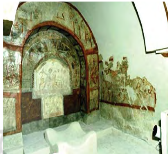
تصویر ۱. بالاسمت راست: کلیسا، چپ: کنیسه، پایین: مهرباه

۳۲-۱۹۳۱ و کنیسه در ۳۳-۱۹۳۲ پیدا شد و مهرباه دورا در میان سال‌های ۳۴-۱۹۳۳ و ۳۵-۱۹۳۴ کاوش گردید (Rostovtzeff, 1939: 3).