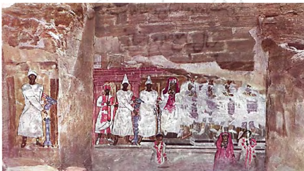
نگاره کونون در پرستشگاه پالمیری، نمونه نقاشی به‌دست‌آمده از دورا اروپوس، (لوح شماره ۸ (Breasted, 1924)