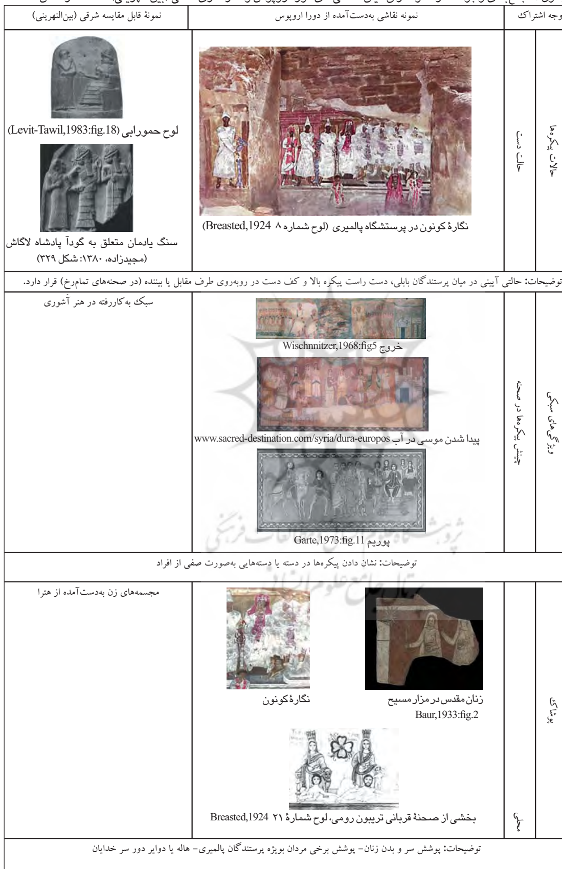
جدول ۱: جمع‌بندی وجوه اشتراک و افتراق میان نقاشی‌های دورا اروپوس و آثار هنری محلی (بین‌النهرینی) مأخذ: نگارندگان.