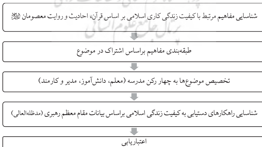
شکل ۱: مراحل تدوین الگوی کیفیت زندگی کاری اسلامی در آموزش و پرورش جهت تربیت اسلامی نسل آینده

تدوین الگوی کیفیت زندگی کاری اسلامی به‌عنوان راهکاری جهت تربیت اسلامی نسل آینده در پنج مرحله به شرح ذیل انجام گرفت: