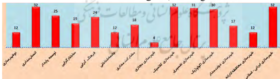
نمودار ۲: توزیع کمتی پارادایم‌های رایج در بستر پایان‌نامه‌های شهرسازی

پارادایم‌های رایج در بستر مطالعات شهرسازی نیز در راستای ارائه شناخت حقایق از محیط شهری دارای «هستی-معرفت-روش» های متنوعی هستند. هر کدام از پارادایم‌های شهرسازی بیانگر نوعی نگرش خاص به مسائل و موضوعات حاکم بر جامعه شهرسازی ایران است. از