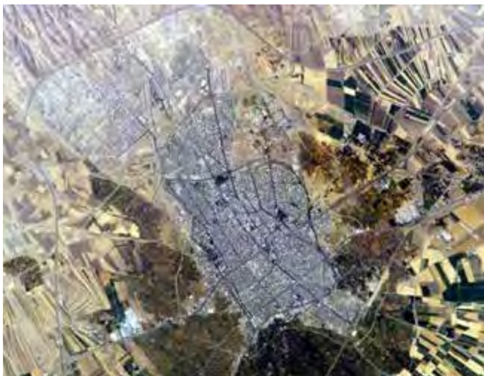
تصویر ۵: عکس هوایی قزوین که شکل نعل اسبی باغستان را در دوران معاصر نشان می‌دهد.

قطعات آن است. خاک‌ریزی لب کرت‌ها در باغ‌های باغستان در حدود یا بیشتر از نیم‌تنه انسان معمولی است و قطعات با توجه به شیب طبیعی زمین در ارتفاع‌های متنوعی قرار گرفته است (تصویر ۷).