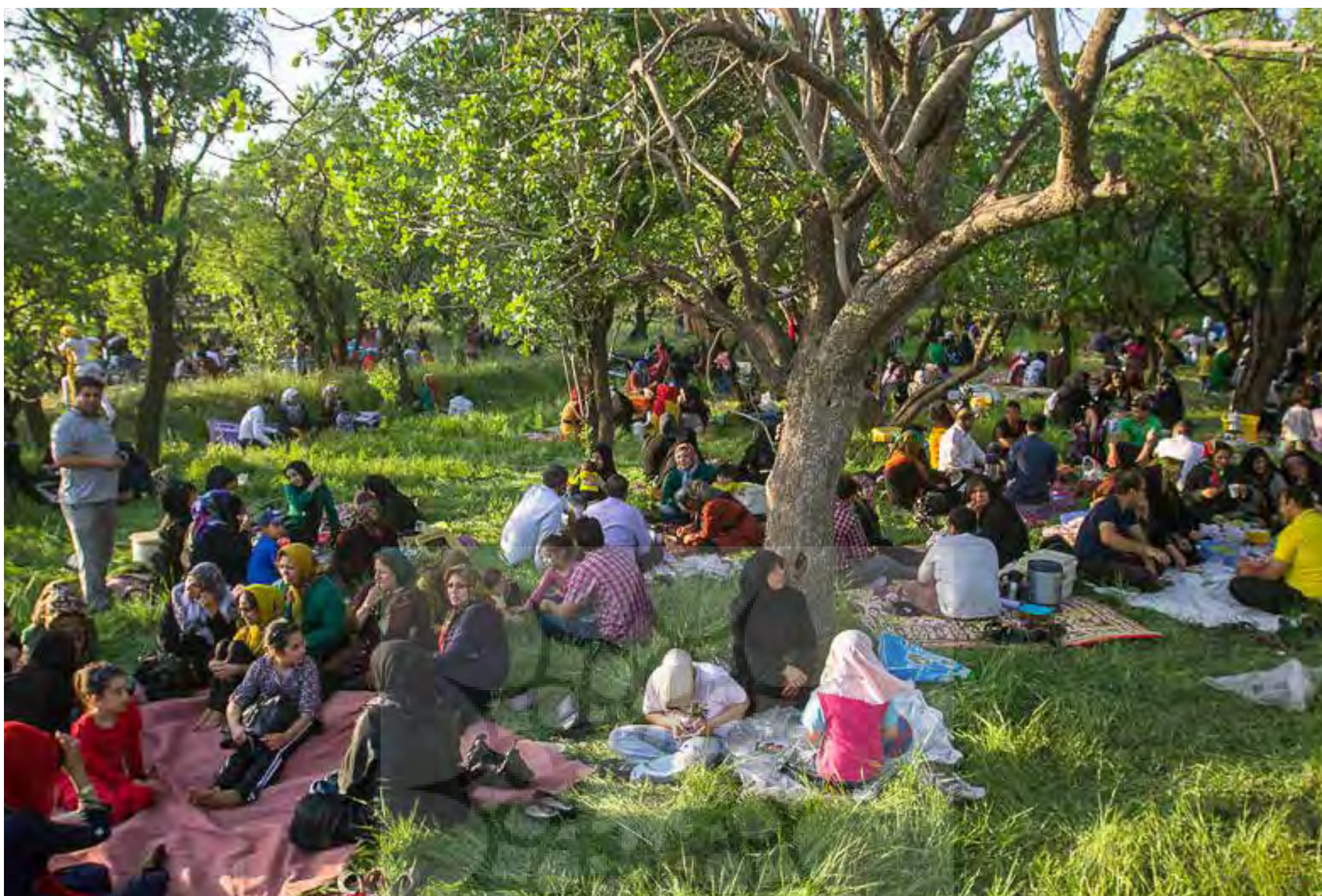
تصویر ۹: حضور مردم شهر در مراسم پنجاه بدر در باغستان سنتی قزوین. عکس: مهدی مجتهد، ۱۳۹۱.

فرآیندهای خاک‌زایی، جذب آلاینده‌ها، نگهداشت و ذخیره آب، کنترل سیلاب، زیبایی دید و منظر و ارزش‌هایی چون ارزش تفریحی، ارزش زیستگاهی، ارزش وجودی، ارزش انتخاب و ارزش میراثی، و امکان محاسبه تمایل به پرداخت افراد برای بهره‌مندی از این خدمات و ارزش‌ها، می‌تواند ارزش واقعی این باغات را نمایان ساخته و در تحلیل هزینه و منفعت مانع از تغییر کاربری و نابودی باغات گردد. بر اساس تحقیقاتی که مشاور شارستان در سال ۱۳۸۸ انجام داده است، ارزش سالانه هشت خدمت اکوسیستمی باغستان سنتی قزوین معادل ۵/۵۴۶/۸۴۰ ریال در هر هکتار و ۱/۳۸۶/۷۱۰ هزار تومان برای کل باغات سنتی در سال است (مهندسین مشاور شارستان و اوربان سولوشنز، ۱۳۸۸: ۴۰).