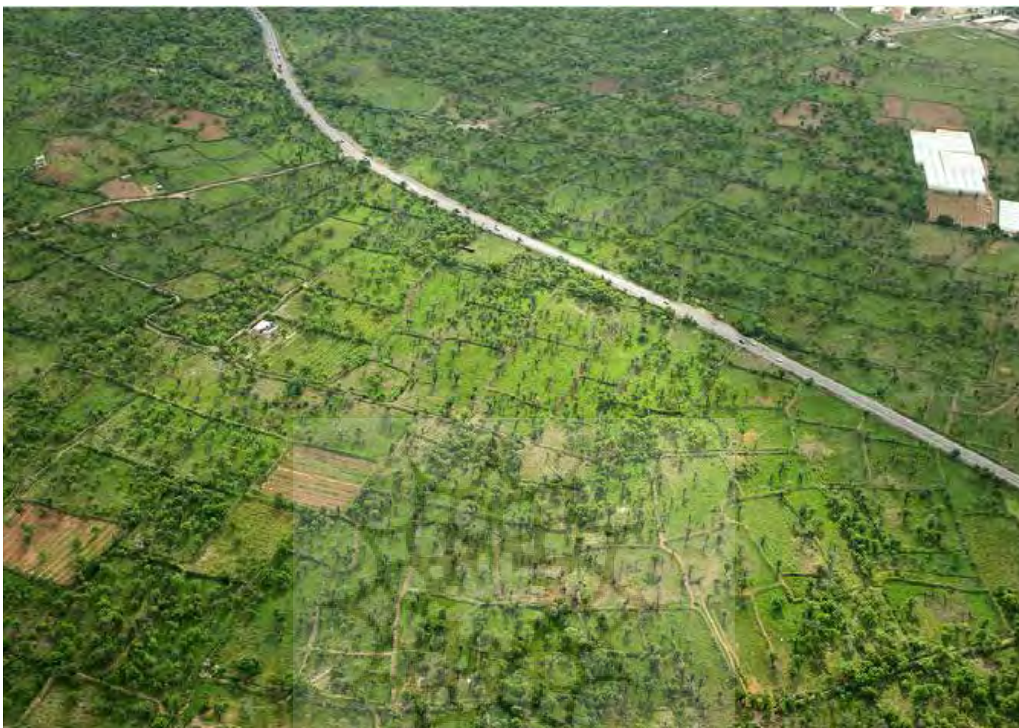
تصویر ۷: نوع استفاده از زمین و کرت بندی قطعات در گوشه‌ای از باغستان سنتی.

بادهای مزاحم قرار نگیرند. «در مجموعه زاغه حدود ۲۱ خانه به‌دست‌آمده است. جهت طولی این خانه‌های مستطیل شکل در نقشه، شمال شرقی به جنوب شرقی و یا بالعکس است. انتخاب این جهت با توجه به جهت بادهای دائمی راز و مه (باد راز باد گرم کویری و باد مه باد سرد) دشت قزوین بوده. در اینجا عرض خانه‌ها در مقابل باد قرار می‌گرفته که دارای سطح کمتری بوده‌اند. این جهت مانع نفوذ بادهای یادشده می‌شد» (ملک شه‌میرزادی، ۱۳۶۶). راهکار باغستان سنتی قزوین در مهار بادها با خانه‌های تپه زاغه متفاوت است. باغستان با محاط نمودن شهر قزوین در دل خود، گردوغبار، سرعت و خشکی باد راز (باد گرم کویری) را مهار نموده و آن را تبدیل به نسیمی ملایم و لطیف برای شهر می‌نماید. باغستان در فصل وزش باد مه (باد سرد) نیز باعث گرفتن سرعت و سوز آن در نتیجه ملایمت وزش آن به شهر می‌شود.