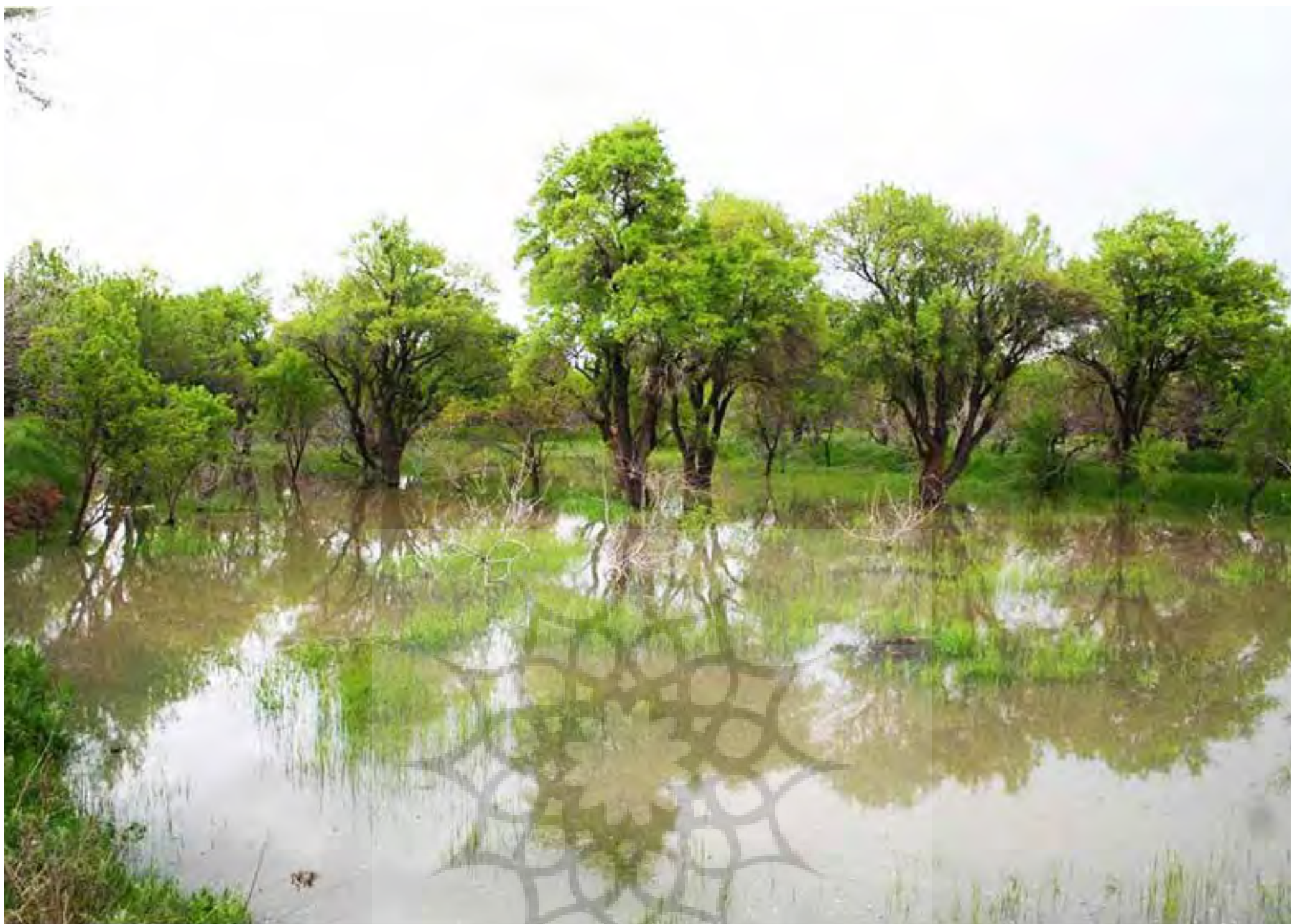
تصویر ۸: باغستان سنتی قزوین و مهار سیلاب و ذخیره آن برای روزهای کم‌آبی.

پژوهشگاه علوم انسانی و مطالعات فرهنگی رئیس‌جمهور