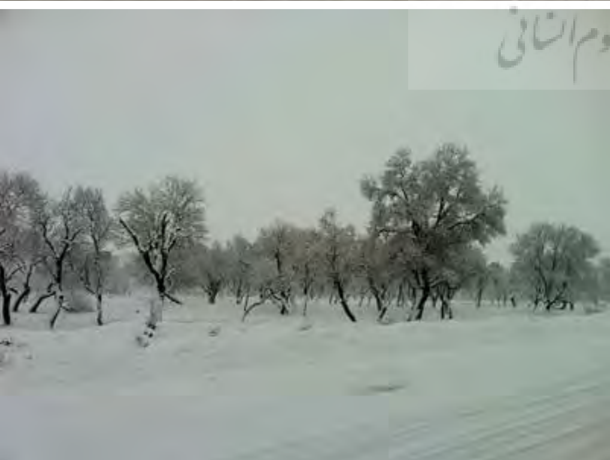
تصاویر ۲، ۱ و ۳: فصول مختلف سال در باغستان سنتی قزوین از انتهای یکی از کوچه‌های لبه قسمت شرقی شهر. عکس: نگارنده، زمستان ۹۵ و بهار ۹۶.

مقدمه | سازگاری اقلیمی، اساس شکل‌گیری شهرها است. گرچه دشت قزوین سابقه‌ای نه‌هزارساله در میزبانی انسان یکجانشین در دل خود دارد، ولی همیشه چالش ناسازگاری‌های اقلیمی برای ایجاد سکونتگاهی پایدار در آن وجود داشته است. وجود بادهای مزاحم و خشک کویری از جنوب دشت قزوین، نبود رودخانه‌های دائمی، بارندگی‌هایی که به دلیل شیب طبیعی زمین در آن سیل به راه می‌اندازد، از جمله دشواری‌های اقلیم این سرزمین است. انسان متمدن برای بقای خود راه‌هایی کشف می‌کند تا نخست از آسیب‌های طبیعت در امان بماند، سپس آن را به خدمت خود درآورد. قرآن کریم می‌فرماید: «الم تروا ان الله سخر لکم ما فی السموات و ما فی الارض (آیا ندیدید که خداوند هر آنچه در آسمان‌ها و زمین است را به تسخیر شما درآورد؟)» (قرآن کریم، ۱۳۹۰: ۴۱۳). جدال با طبیعت و مهار کردن آن در دشت قزوین، برای انسان یکجانشین گرچه بیش از هفت هزار سال طول می‌کشد ولی نتیجه‌اش ایجاد تمدنی پایدار به نام شهر قزوین است. باتدبیر انسان یکجانشین، طبیعت ناآرام برای زندگی انسان، به طبیعتی اهلی، برای ماندگاری انسان تبدیل می‌شود. به دیگر سخن راهکار اصلی انسان یکجانشین در دشت قزوین بهره‌گیری از خود طبیعت برای رام کردن طبیعت بود؛ از نمونه‌های منحصر به فرد این‌گونه اقدامات، ایجاد باغستان سنتی قزوین بود؛ طبیعتی مصنوع که برای پایداری شهر قزوین ایجاد شده است و تا امروز این نقش حیاتی را باوجود ناملایماتی شهری ادامه می‌دهد (تصاویر ۱، ۲ و ۳).