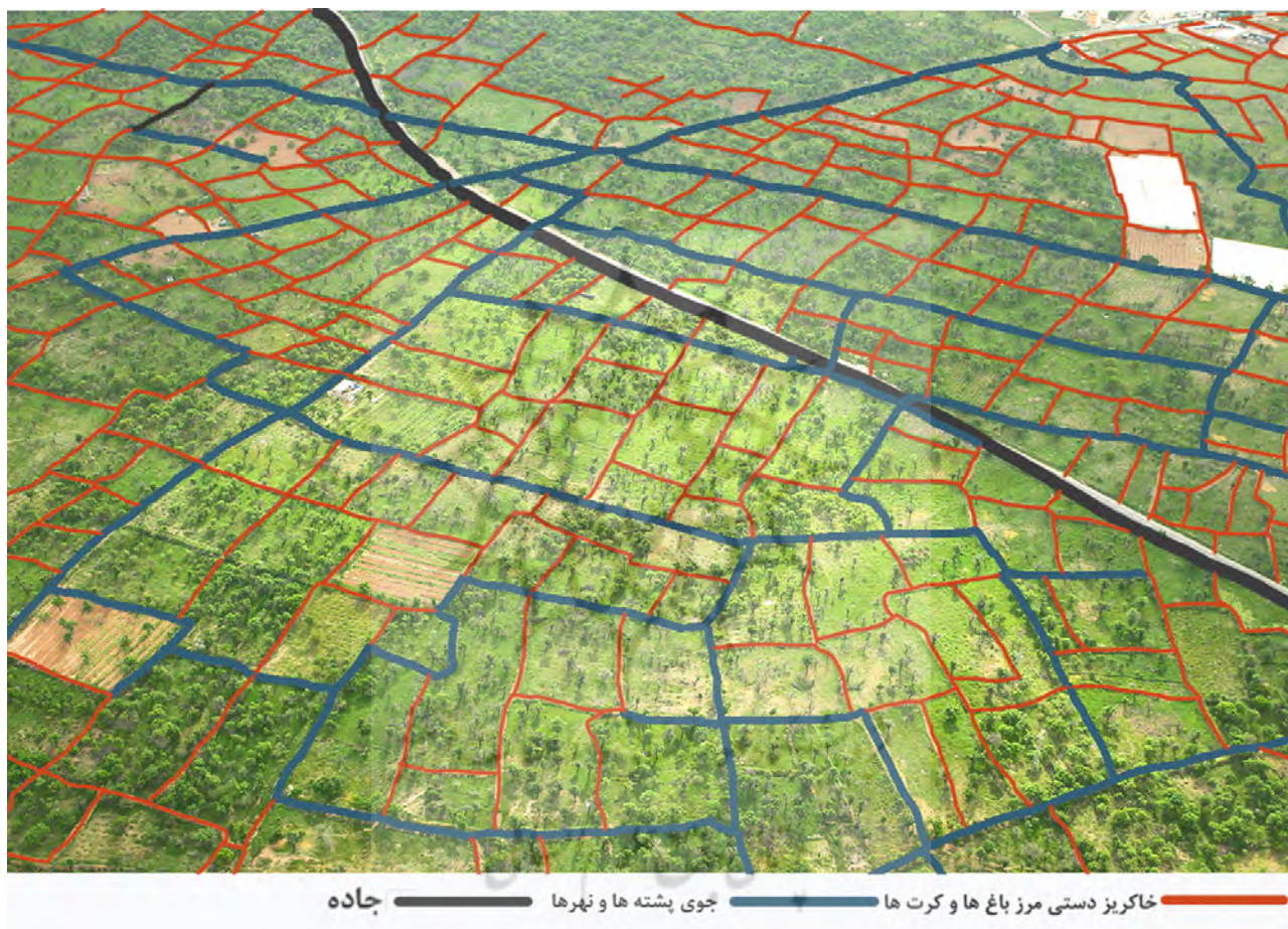
تصویر ۴. طرح و نقش زمین از دید پرنده به شکل قطعات نامنظم ارگانیک با مرز پشته‌های خاک زمینی. بازترسیم از نگارندگان.

سنتی قزوین همگی به هم پیوسته بوده و دارای رابطه علت و معلولی هستند یعنی وابسته به یکدیگر به وجود آمده و ادامه‌ زندگیشان به هم وابسته است. رویکرد منظر فرهنگی در شناخت خصیصه‌های باغستان بومی تاریخی قزوین تنها به ثبت چند بنای تاریخی یا چند درخت کهنسال محدود