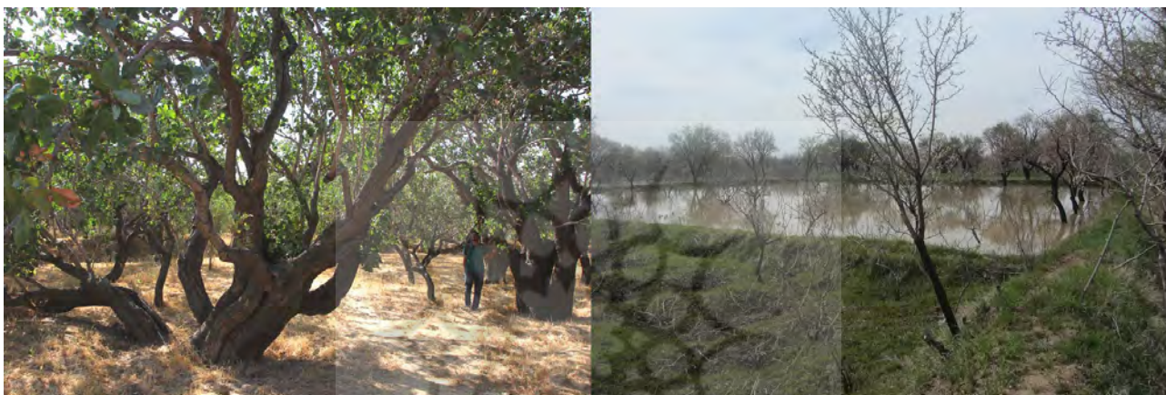
تصویر ۱. راست: شیوه کشت مختلط گیاهان باغستان و آبیاری غرقابی باغستان. مأخذ: نگارندگان. چپ: درختان کهنسال پسته در فصل محصول. مأخذ: آرشیو شخصی مهدی معتمد.

محصول دهند. باغستان سنتی قزوین طبق تعریف زکریابن محمد بن محمود قزوینی (۶۰۵-۶۸۳)، پس از قرن ششم هجری همانند حلقه‌ای سبز در اطراف شهر شکل گرفته‌اند (گلریز، ۱۳۸۲: ۱۴۶)؛ (تصویر ۳، راست) و در دوره‌های مختلف تاریخی ایران به حیات خود ادامه داده‌اند. شواهد حضور باغ‌ها در سفرنامه‌های متعلق به دوره‌های صفوی (همانند دل لاوله و تاورنیه) و قاجار (همانند مامونف و دیولافوا) موجود است. در نقشه