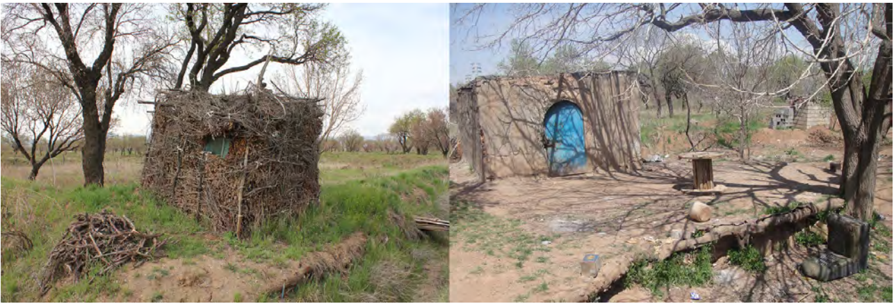
تصویر ۲. راست: چاه خانه با درختان سایه انداز همانند توت برای استراحت باغبانان. مأخذ: نگارندگان. چپ: آله ساخته شده از شاخه درخت برای دیده بانی باغبانان. مأخذ: نگارندگان.

برگه ای (نصفه ای) (ورجاوند، ۱۳۷۷: ۱۸). در نظام مالکیت و مدیریت پیش گفته رابطه نزدیک میان مالکان و مدیران بسیار اهمیت داشته و تفاهم آنان بر روی سود حاصل از درآمدها حیاتی بوده است. چنین مناسباتی رابطه انسانی جوامع محلی قزوینی را بسیار قوی می ساخته است. جمع بندی صفات و خصیصه های منظر فرهنگی باغستان سنتی قزوین در جدول فوق نشان می دهد که عناصر طبیعی و پوشش گیاهی شامل آب، خاک، پوشش گیاهی و توپوگرافی و عناصر مصنوع شامل سازماندهی فضایی و طرح و نقش زمین، عناصر آبیاری، مسیرهای حرکت و ساختارها و اشیاء به همراه عوامل انسانی و مدیریتی شامل روش های آبیاری، روش های باغبانی، نظام مدیریت و باغبانی و نظام مالکیت باغستان