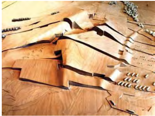
تصویر شماره (۸). Galicia، اسپانیا، ۱۹۹۹، پیتر آیزنمن، شهر فرهنگ