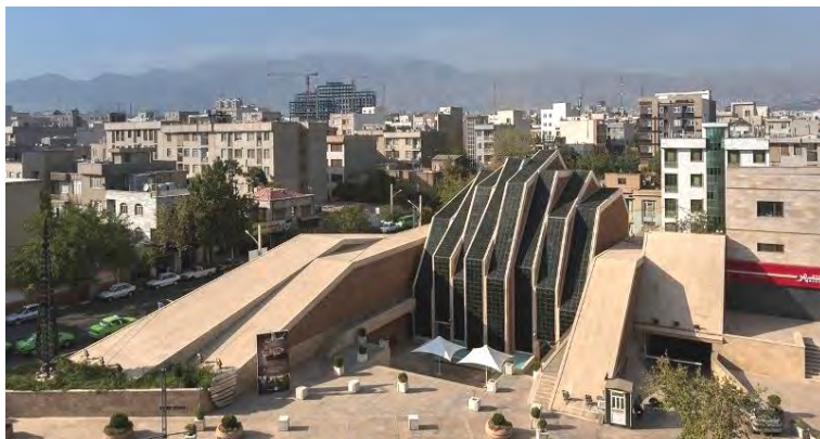
تصویر شماره (۴). تهران، مسجد و مؤسسه فرهنگی امام رضا علیه السلام شباهت این مجموعه مذهبی به بناهای انتفاعی و تجاری کاملاً مشهود است.

رانده شده است و حتی اگر با دستورالعمل‌های اداری، در کانون کالبدی شهر نیز مکان‌یابی شود، از حقیقتی که در شهر سنتی حامل آن بود، تهی شده است، زیرا در شهر مدرن، همه‌چیز حتی امور معنوی بر پایه عقلانیت مادی مبتنی بر سکولاریسم، تعریف و تفسیر می‌شود.