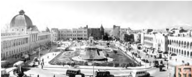
تصویر شماره (۷). میدان توپخانه تهران

اما برای نخستین بار، در میدان توپخانه تهران، فضایی شهری ساخته شد که با تأثیرپذیری از تمدن سکولار غرب، تمام بدنه‌های آن، بیانگر عناصر کالبدی مدرن بودند و جایی برای بناهای مذهبی در بدنه‌های این میدان پیش‌بینی نشد (تصویر شماره ۷).