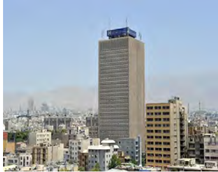
تصاویر شماره (۲) و (۳). تسلط بانک به عنوان نماد کانون ثروت بر بافت شهری معاصر در مقایسه با تسلط مسجد به عنوان نماد کانون معنویت و عبودیت بر بافت شهری سنتی

ممکن است چنین تصور شود که می توان با بازگرداندن کانون کالبدی شهرهای معاصر از مراکز مالی و تجاری به مراکز عبادی، این مسئله را حل کرد، اما این تصور بسیار ساده انگارانه است، زیرا این اقدام، تنها تغییری سطحی و صوری است و نه بنیادین و هیچ تناسبی با بنیان های فکری جریان تجدد و به ویژه سکولاریسم - که شهرهای معاصر زاینده آن هستند - ندارد. به بیان دیگر، همان گونه که اغلب مناسبات انسانی شهر سنتی، متأثر از مسجدها و بناهای مذهبی بود و ممکن نبود که کانون شهر، در جای دیگری به جز این بناها تعریف شود، مهم ترین مناسبات شهر معاصر نیز در بناها و مراکز مالی و تجاری تعریف می شود؛ زیرا تکوین و توسعه شهر مدرن، محصول روابط برگرفته از عقلانیت مادی است و اقتصاد، مؤلفه اصلی در توسعه این شهر است؛ بنابراین، انتقال کانون کالبدی شهرهای مدرن از بانک ها و مراکز تجاری به مراکز عبادی، نه تنها راه حل نیست، بلکه خود مشکل تازه ای ایجاد می کند؛ زیرا این امر، کاریکاتوری از شهر اسلامی را (بدون توجه به حقیقت و باطن آن) پدید می آورد؛ شهر دگرگون شده ای که اگرچه صورت کالبدی آن تا حدی شبیه به شهر سنتی اسلامی خواهد شد، اما باطنی کاملاً متمایز از آن دارد.