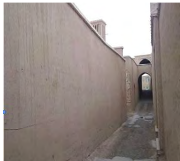
تصویر شماره (۱۲). بافت تاریخی ابرکوه؛ بدنه بیرونی کاملاً ساده بناهای مسکونی به‌رغم غنای مالکان این بناها در محله سنتی و اعیانی

باب در نکوهش فخرفروشی در مسکن با استفاده از مواردی همچون ارتفاع زیاد ساختمان و تجمل‌گرایی در آن است ۱ . از روایت‌های ذکرشده در این مورد، می‌توان به این روایت امام حسین علیه السلام اشاره کرد که پس از مشاهده خانه‌ای مرتفع و مجلل که دال بر فخرفروشی مالک آن بود، درباره او چنین فرمودند که با بالا بردن ارتفاع خانه، دین خود را فرو نهاده است: «مَرَّ الْحُسَيْنُ علیه السلام بِدَارٍ بَعْضِ الْمَهَالِيهِ فَقَالَ رَفَعَ الطَّيْنَ وَوَضَعَ الدِّينَ: امام حسین علیه السلام منزل (مجللی) را دید، فرمود گِل‌ها را بالا برد و دین خود را پایین آورد» (محدث نوری، ۱۴۰۸ هـ.ق، ۴۶۷). روایت‌های دیگری نیز نقل شده است که همگی دلالت بر لزوم سادگی بدنه‌های بیرونی منازل و پرهیز از فخرفروشی از طریق معماری مسکن دارند (شیخ حر عاملی، ۱۴۰۹ هـ.ق؛ ابن بابویه، ۱۳۷۷، ۵۵۶). بر همین اساس، در بافت‌های مسکونی سنتی، تفاوت چندانی در بدنه‌های بیرونی بناهای مسکونی مشاهده نمی‌شد و نمای مسکن به‌عنوان ابزاری برای خودنمایی و فخرفروشی و ارضای امیال پست انسان، به‌کار نمی‌رفت؛ به‌گونه‌ای که فقر یا غنای مالک منزل از نمای بیرونی آن قابل تشخیص نبود و تنها بدنه‌ها و فضای داخلی منازل که فضایی خصوصی بود و در معرض دید دیگران نبود، بیانگر توان مالی مالک منزل بود، اما در شهر معاصر ایرانی، موارد متعددی را می‌توان مشاهده کرد که طرح نمای مسکن به‌عنوان ابزاری برای ارضای میل‌های پست انسان (مانند خودنمایی و فخرفروشی) به‌کار می‌رود، به‌گونه‌ای که برخلاف بافت‌های مسکونی سنتی، در بافت‌های معاصر با مشاهده بدنه‌های بیرونی منازل به‌راحتی می‌توان به فقیر یا ثروتمند بودن ساکنان آن بافت پی برد (تصاویر شماره ۱۱ و ۱۲).