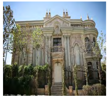
تصویر شماره (۱۱). نمونه‌ای از نمای بیرونی یک ویلاي معاصر در تهران که ارتفاع غیرمتعارف و تجمل‌گرایی در آن مشهود است.