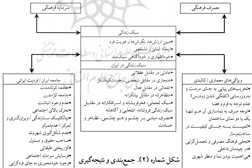
شکل شماره (۲). جمع‌بندی و نتیجه‌گیری