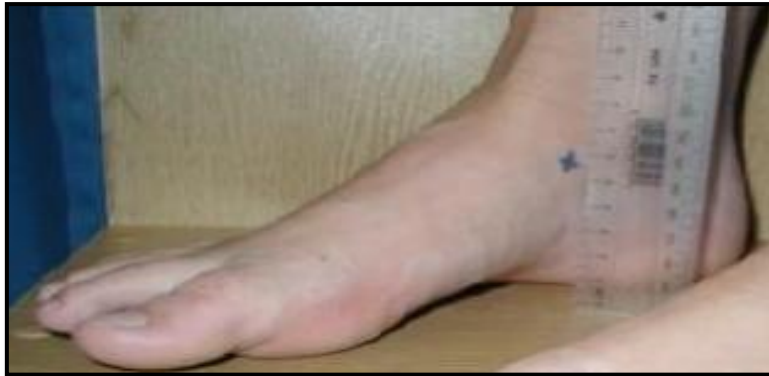
شکل ۳. اندازه گیری افت ناوی

در جدول شماره ۱، میانگین و انحراف معیار اطلاعات توصیفی مربوط به اندازه گیری های آنتروپومتریک آزمودنی ها شامل قد، وزن و سن جهت شناخت بیشتر ویژگی های آزمودنی ها ارائه شده است.