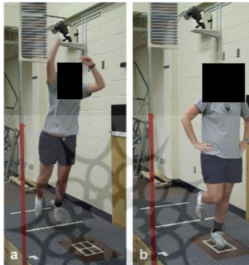
شکل ۱. نحوه انجام پروتکل پرش-فرود روی دستگاه توزیع فشار کف پا

می‌کرد. آزمودنی‌ها چندین مرتبه آزمون را به منظور آشنایی انجام می‌دادند و در آخر، سه مرتبه، آزمون تکرار و داده‌ها ثبت می‌شد (۱۶) (شکل ۱).