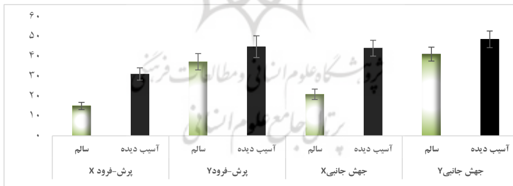
شکل ۳. مقایسه میانگین‌های نوسان پاسچر آزمودنی‌ها در طول دو محور X و Y

نتایج حاصل از جدول ۳ نشان می‌دهد که، افراد با پیچ‌خوردگی مچ پا نوسان‌های داخلی-خارجی (جابه‌جایی‌های محور X) بیشتری در هر دو مهارت پرش-فرود و جهش جانبی، نسبت به افراد سالم دارا بوده‌اند (شکل ۳).