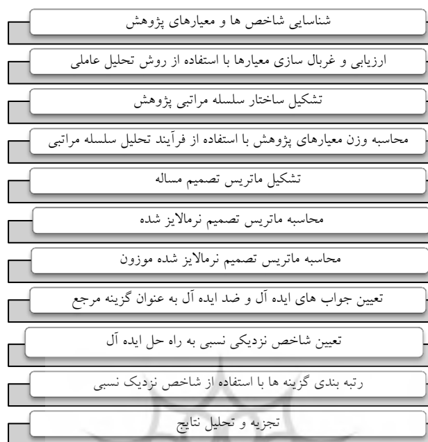
شکل ۱. چارچوب انجام پژوهش

می‌باشد. در این گام معیارهایی که در ارزیابی انواع رسانه‌های ورزشی می‌تواند استفاده شوند شناسایی و لیست می‌شود. جدول شماره ۱ لیست معیارهای شناسایی شده برای ارزیابی رسانه‌های ورزشی را ارائه می‌کند.