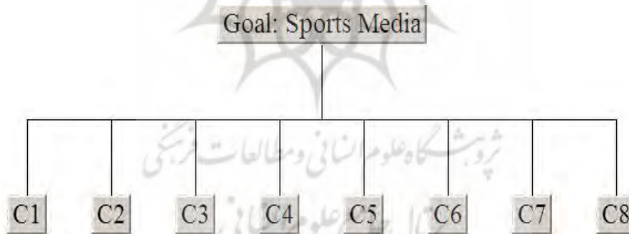
شکل ۲. ساختار سلسله‌مراتبی معیارهای پژوهش

پس از شناسایی معیارهایی تأیید شده به تشکیل ساختار سلسله مراتبی پژوهش می‌پردازیم. شکل شماره ۲ ساختار سلسله مراتبی پژوهش را نشان می‌دهد. با مشخص شدن ساختار سلسله مراتبی پژوهش می‌توان به مقایسه زوجی معیارها