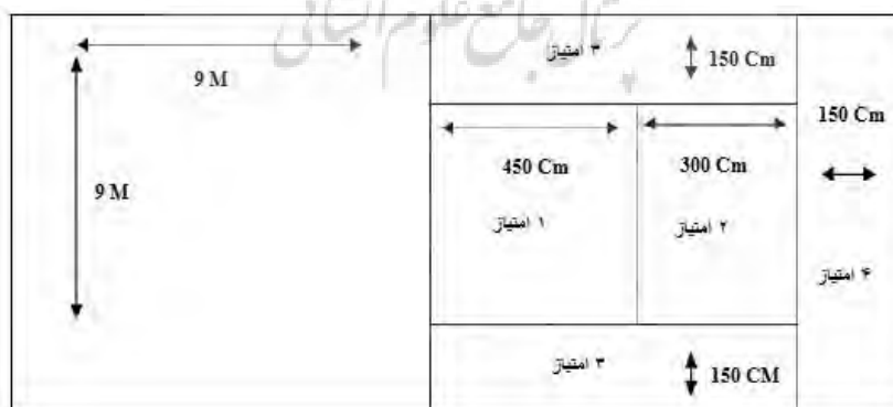
شکل ۱- آزمون سرویس والیبال ایفرد

به‌منظور جمع‌آوری اطلاعات در زمینه سن، جنس، سابقه فعالیت ورزشی و سلامت جسمانی از فرم مشخصات فردی استفاده شد. همچنین، کارت نشانه هدف‌چینی در مرحله دوراندیشی؛ کارت نشانه خودضبطی در مرحله عملکرد؛ کارت‌های نشانه خودارزیابی، مقیاس اسناد سببی و مقیاس استنباط‌های انطباقی در مرحله خوداندیشی مورد استفاده قرار گرفت. از آزمون دقت سرویس والیبال ایفرد ۱ نیز برای اندازه‌گیری صحت و دقت اجرای مهارت سرویس استفاده شد و امتیاز اجرا در پیش‌آزمون، مراحل اکتساب، آزمون اکتساب، آزمون یادداری و آزمون انتقال محاسبه گردید. شایان‌ذکر است که در این آزمون به توپ‌هایی نمره داده می‌شود که در مناطق دارای امتیاز فرود آیند (پیش از شروع آزمون از آزمودنی خواسته شده بود که توپ را به همان منطقه بزند) و توپ‌هایی که بر روی خط فرود می‌آیند، بیشترین امتیاز را به‌خود اختصاص می‌دهند. همچنین، چنانچه پای سرویس‌زننده در هنگام زدن سرویس در منطقه خطا باشد، نمره صفر به سرویس تعلق می‌گیرد و به بازیکن فرصت داده می‌شود تا دوباره سرویس بزند. ذکر این نکته ضرورت دارد که توپ‌هایی که از روی تور عبور نمی‌کنند، به‌عنوان یک تکرار بدون امتیاز محسوب می‌شوند. به‌منظور اجرای دستورالعمل این آزمون، یک نیمه از زمین به چند منطقه مطابق شکل یک تقسیم شده و امتیازهای یک تا چهار در آن علامت‌گذاری می‌شود (شکل شماره یک) (۲۵).