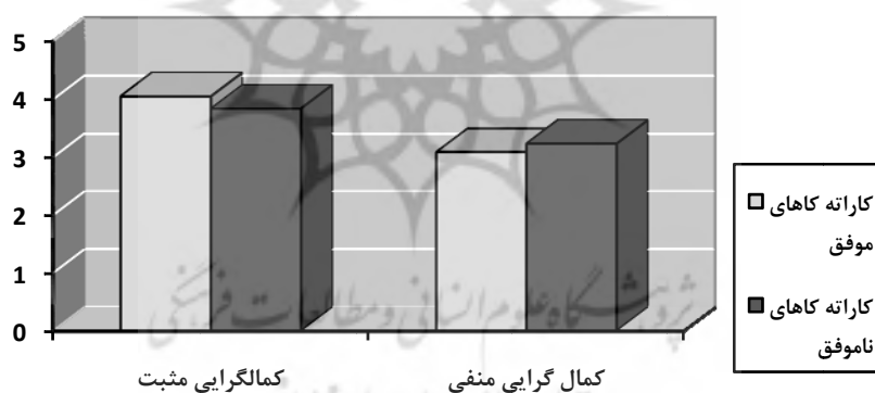
نمودار ۲. مقایسه میانگین نمره‌های کمال‌گرایی مثبت و منفی در دو گروه کاراته‌کای موفق و ناموفق

در نمودار ۲ میانگین نمره‌های کمال‌گرایی مثبت و منفی در دو گروه ترسیم شده است.