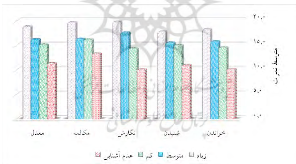
نمودار ۳) متوسط نمرات پیشرفت تحصیلی بر اساس میزان آشنایی با زبان دوم

نتایج جدول (۷) نشان می‌دهد که برای هر چهار مهارت و همچنین معدل کل، اختلاف معناداری بین نمرات پیشرفت تحصیلی (مهارت‌های زبانی) گروه‌های مورد بررسی در سطح یک درصد وجود دارد (سطح معناداری <0.01 ). البته برای مهارت مکالمه، این اختلاف در سطح ۵ درصد معنادار شده است. با توجه به متوسط نمرات در جدول (۶)، مشاهده می‌شود که افزایش میزان آشنایی با زبان خارجی اول، بر یادگیری زبان جدید، تأثیر مثبت و معناداری دارد. نمودار (۳) نیز به بیان متوسط نمرات پیشرفت تحصیلی آزمودنی‌ها بر مبنای میزان آشنایی با زبان دوم (انگلیسی) می‌پردازد: