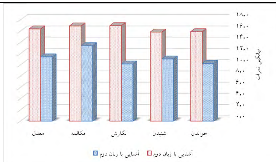
نمودار ۲) میانگین نمرات مهارت‌های زبان فارسی بر اساس آشنایی با زبان دوم