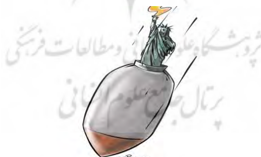
کاریکاتور (۱) استعاره تصویری آزادی (امریکایی) جنگ است

در کاریکاتور (۱) شاهد استعاره تصویری آزادی (امریکایی) جنگ است هستیم. در این کاریکاتور تنها نمود بصری فعال است که در آن دو مفهوم قابل بازیابی است: مفهوم انتزاعی آزادی که با رابطه نمادین آن با مجسمه آزادی نیویورک در ذهن انگیزته می‌شود و حوزه مقصد است. مفهوم مبدأ، مفهوم جنگ است که از طریق تصویر بمب یا موشک در ذهن تداعی می‌شود و درک آن نیاز به تلاش ذهنی چندانی از سوی مخاطب ندارد. در کاریکاتور (۱)، این دو فضای مفهومی (آزادی و جنگ) با هم تلفیق شده‌اند. همانطور که فورسویل در مورد روش‌های ارتباط حوزه‌های مبدأ و مقصد در تصویر و زبان گفته است «در تلفیق حوزه‌های مبدأ و مقصد هر دو در یک جمله یا تصویر به طور تلفیقی ظاهر می‌شوند.» این ارتباط باعث شکل‌گیری نگاهت یک یا چند مولفه معنایی از مبدأ جنگ بر مقصد آزادی می‌شود.