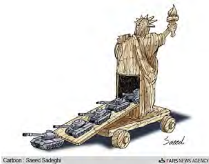
کاریکاتور ۲) استعاره تصویری آزادی (امریکایی) جنگ است

(کاریکاتورست: سعید صادقی)