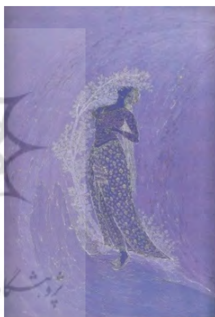
تصویر ۱: «سرو بلند قامت»، ۶۳/۵×۴۴/۵، غنایی، ۱۳۳۴ ماخذ: (ناصری پور، ۱۳۸۳: ۱۳۵)