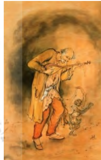
تصویر ۷: «غم و شادی»، ۳۸/۸×۲۴، غنایی، ماخذ: (Farshchian, 1991, 205)