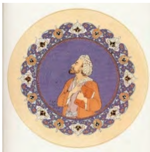
تصویر ۳: «خیام»، ادبی ماخذ: (ناصری پور، ۱۳۸۳: ۱۲۰)