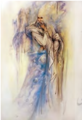
تصویر ۹: «خیام»، ۸۱/۳×۵۰/۸، ادبی، ۱۳۷۱، ماخذ: (Farshchian, 2004, 212)