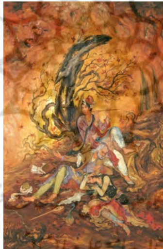
تصویر ۸: «حکایت نی»، ۱۱۰×۸۰، معنوی و عارفانه، ۱۳۴۸ ماخذ: (فرشچیان، ۱۳۵۵، ۳۶)