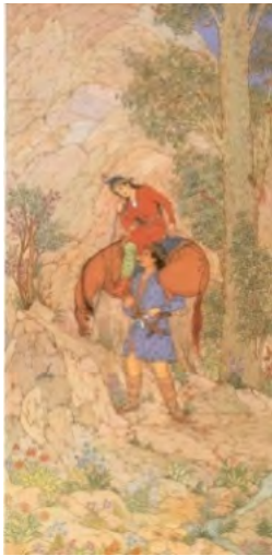
تصویر ۶: «شیرین و فرهاد»، ۱۵/۴×۸۱/۲، عاشقانه