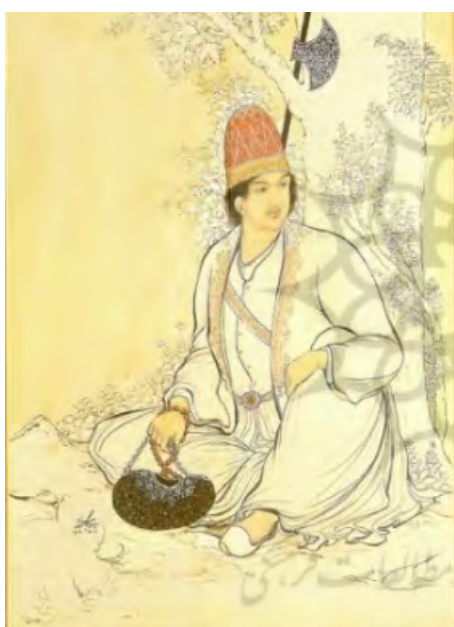
تصویر ۲: «نور علیشاه»، ۳۷×۵۰/۵، اجتماعی، ۱۳۳۰ ماخذ: (ناصری پور، ۱۳۸۳: ۱۲۴)

نمونه‌های معیار (منتخب) طبقات موضوعی در آثار حسین بهزاد (تصاویر ۱ - ۶)