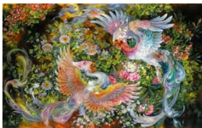
تصویر ۱۲: «عطر محبت»، ۵۰/۸×۸۱/۳، طبیعی و تمثیلی، ۱۳۷۷، ماخذ: (Farshchian, 2004, 165-6)