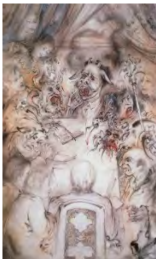
تصویر ۱۱: «جلسه»، ۸۱/۳×۴۵، اجتماعی، ماخذ: (Farshchian, 2004, 98)