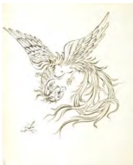
تصویر ۴: «سیمرغ»، ۲۸×۲۲/۵، تاریخی و اساطیری