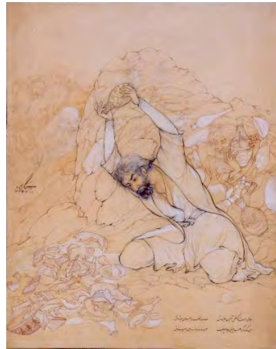
تصویر ۵: «جامی است که عقل آفرین می زندش»، ۵۰×۳۹، فلسفی، ماخذ: (ناصری پور، ۱۳۸۳: ۱۳۴)