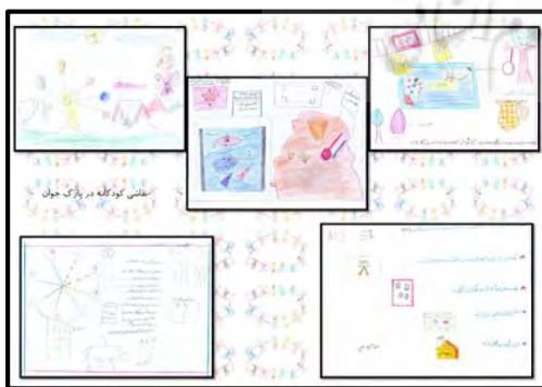
شکل ۶- نقاشی کودکان در پارک جوان