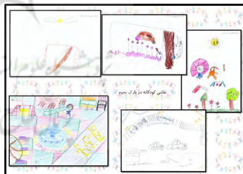
شکل ۹- نقاشی کودکان در پارک نجوم

شکل (۹) مربوط به نقاشی کودکان در پارک نجوم می باشد. با توجه به عدم وجود وسایل بازی مناسب در این پارک، انتظارات این کودکان از محل بازی در محله خود عبارتند از: زمین بازی با کفپوش مناسب، تاب و سرسره، ماشین شارژی، نیمکت های متحرک و محوطه ای برای حضور حیوانات خانگی می باشد.