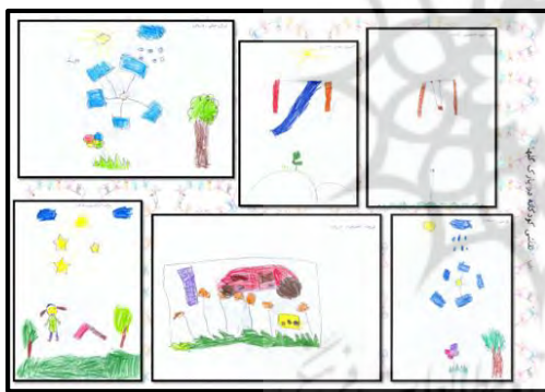
شکل ۴- نقاشی کودکان در پارک گلها

در شکل (۳) کودکان محدوده پارک اسلام آباد الگوی فضای بازی مدنظر خود را وجود بازی های فکری در قالب زمین شطرنج، سرسره های چرخشی و طولانی، تابهای قابل تنظیم (از نظر دور چرخش)، محوطه بازی های گروهی (اعم از وسطی، استپ هوایی و...) ترسیم کرده اند. همچنین وجود سطل زباله در پارکها از نکات مورد توجه ترسیم شده در این نقاشی ها است. شکل (۴) نقاشی کودکان در پارک گلها می باشد. بدلیل عدم وجود وسایل بازی مناسب در این پارک، آنها انتظارات خود از زمین بازی را وجود وسایل بازی سنتی اعم از تاب، چرخ و فلک، سرسره و فضای سبز نقاشی کرده اند. همانطور که ملاحظه می شود، انتظارات کودکان استفاده کننده از این پارک بسیار پایین می باشد.