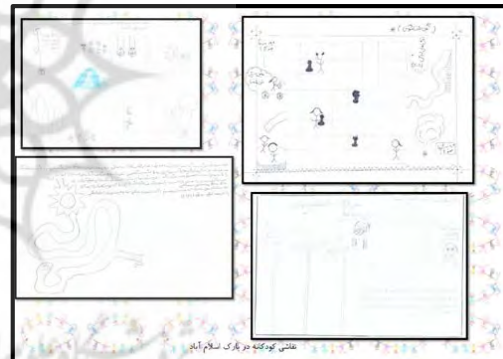
شکل ۳- نقاشی کودکان در پارک اسلام آباد