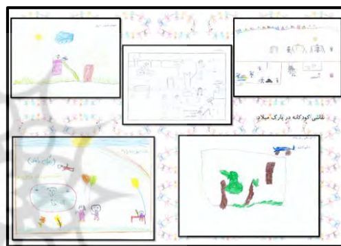
شکل ۷- نقاشی کودکان در پارک میلاد