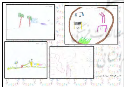
شکل ۱۰- نقاشی کودکان در پارک زیباشهر