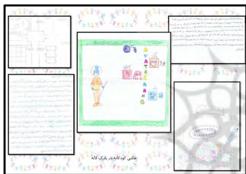
شکل ۸- نقاشی کودکان در پارک لاله

شکل (۸) مربوط به نقاشی ها و انتظارات کودکان در پارک لاله می باشد. در این تصاویر کودکان فضای بازی مورد علاقه خود شامل مواردی چون: استفاده از شخصیت های کارتونی، زمین بازیهای فکری، وسایل بازی آموزشی، حوضچه آب، دکه های سیار اغذیه فروشی و وجود سرویس بهداشتی ذکر نموده اند.