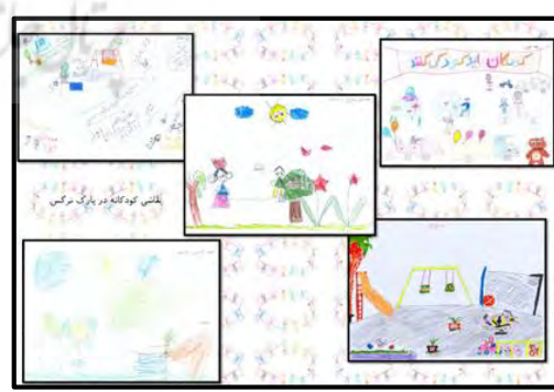
شکل ۵- نقاشی کودکان در پارک نرگس

در شکل (۵) کودکان محدوده پارک نرگس در نقاشی های درخواستی مربوط به فضای بازی مورد علاقه خود، انتظارات خود را وجود زمین بازی ایمن، کفپوش مناسب، زمین های ورزشی اعم از: زمین والیبال و محوطه دوچرخه سواری ماشین برقی و اسکیت، برگزاری مسابقات و بازیهای گروهی، محل مخصوص نقاشی بر روی بومرنگ و وجود خدماتی اعم از سرویس بهداشتی و روشنایی مناسب عنوان کرده اند.