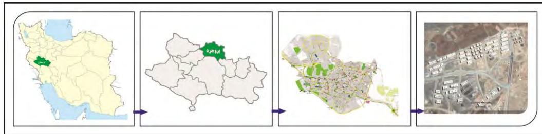
شکل ۱ - موقعیت مکانی بروجرد و مسکن مهر آن

شهر بروجرد از نظر تقسیمات سیاسی متعلق به استان لرستان در غرب کشور است. این شهرستان در شمال استان واقع شده است و در ارتفاعات بیش از ۱۵۰۰ متر قرار دارد. وسعت این شهرستان ۱۶۰۶ کیلومتر مربع است که ۵/۷۲ درصد از مساحت استان لرستان را تشکیل میدهد. این شهرستان در ارتفاع ۱۵۸۰ متری از سطح دریا و در عرض های شمالی حداقل ۳۳ درجه و ۳۶ ثانیه و حداکثر طول ۳۴ درجه و ۶ دقیقه و طول شرقی و داخل ۴۸ درجه و ۲۷ دقیقه و حداکثر ۴۹ درجه و ۲۷ دقیقه قرار دارد. (شکل ۱).