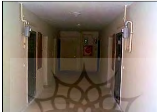
تصویر ۲- درهای ورودی واحد ها روبروی هم

این عوامل از مجموعه ای از کارهای فرهنگی و حتی قانونی تشکیل شده که به ذکر آن می پردازیم. شاید بهترین اقدام در این زمینه آگاه کردن افراد به حقوقی باشد که در شرع و قانون ذکر و با اجرای آن حقوق همسایگان از آزار یکدیگر در امان خواهد بود. شیوه خاص ساختمان سازی ها گاهی کاملاً اشتباه می باشد و به جای اینکه به آسایش افراد توجه شود به زیبایی آن پرداخته شده است. از جمله: قراردادن در های رفت و آمد ۲ خانواده رو به روی هم به طوری که اگر هر دو همزمان از خانه خارج شوند به یکدیگر برخورد خواهند کرد (تصویر ۲).