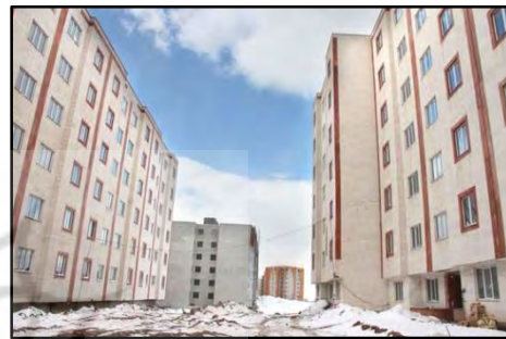
تصویر ۴- وضع نابسامان اطراف بلوک ها از نظر آسفالت و نظافت شهری