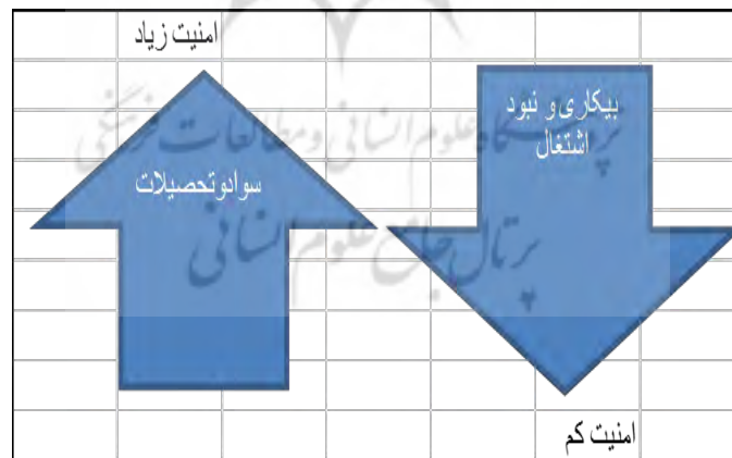
شکل ۳- رابطه سواد و بیکاری با امنیت

با توجه به نظرات ساکنان، ۸۶ نفر تأثیر سواد و فرهنگ را در امنیت زیاد می‌دانند، همچنین ۸۵ نفر تأثیر بیکاری و نبود اشتغال را در نبود امنیت زیاد می‌دانند. در نتیجه سواد با امنیت رابطه مستقیم و بیکاری با ناامنی رابطه مستقیم دارد، بنابراین هر چه سواد شهروندان کمتر باشد و افراد تحصیلکرده در شهر کم باشد، ناامنی افزایش پیدا می‌کند و هر چه بیکاری کمتر شود، حس امنیت بالاتر می‌رود.