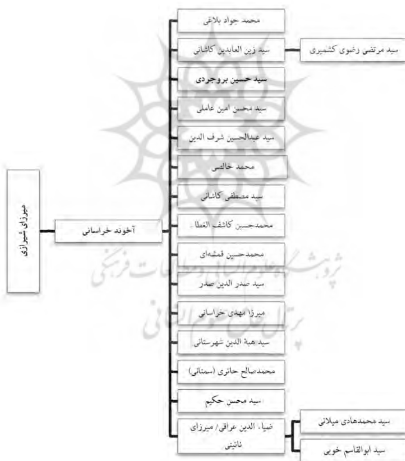
شکل ۴. تبار علمی حلقه شاگردان آخوند خراسانی

از علمای اسلام، از طریق صدور فتاوی جهادی علیه استعمار بریتانیا به حمایت از سرزمین‌های اسلامی (دولت عثمانی) پرداختند. برخی دیگر از شاگردان آخوند خراسانی، همانند آیات سیدحسین بروجردی، سیدهبه‌الدین شهرستانی، سیدمرتضی رضوی کشمیری، سیدمحسن امین عاملی، سیدعبدالحسین شرف‌الدین، محمد صالح حائری (سمنانی) و قوام‌الدین محمد وشنوی با دارالتقرب قاهره همکاری داشتند (نک: شکل ۴).