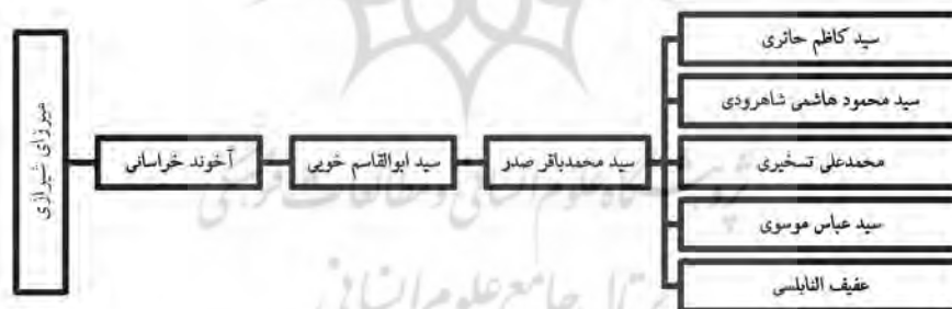
شکل ۱. تبار علمی شهید آیت‌الله سید محمدباقر صدر و شاگردان ایشان

بسیاری از شاگردان شهید صدر به جریان تقریب و وحدت اسلامی پیوستند و از اعضای رسمی مجمع جهانی تقریب مذاهب اسلامی بودند (نک: شکل ۱).