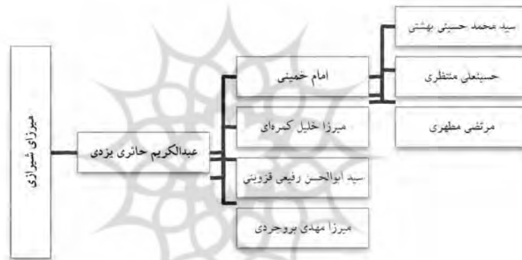
شکل ۵. تبار علمی آیت‌الله حاج شیخ عبدالکریم حائری یزدی

یکی از مهم‌ترین کانون‌های اجتماع علمای تقریبی، مکتب آیت‌الله‌العظمی حاج شیخ عبدالکریم حائری یزدی در قم است که بعدها با مکتب فقهی آیت‌الله سیدحسین بروجردی تلاقی پیدا کرد. شخصیت‌های برجسته‌ای در مکتب ایشان تلمذ کردند که برخی از چهره‌های بزرگی در جهان اسلام گردیدند (نک: شکل ۵).