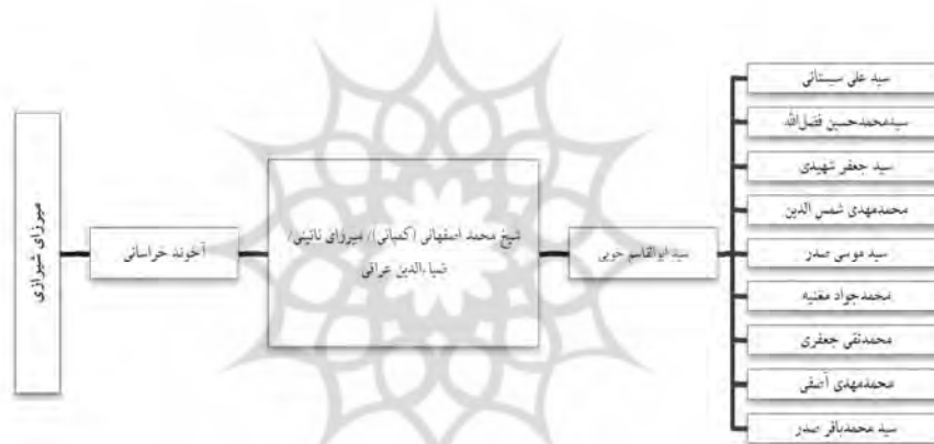
شکل ۳. تبار علمی شاگردان آیت‌الله سیدابوالقاسم خوبی

نائینی و آقا شیخ محمد حسین اصفهانی (کمپانی) هستند که از میان شاگردان ایشان حوزه تدریس آیت‌الله‌العظمی سیدابوالقاسم خوبی اهمیت دارد. شاگردان شهیر او از قبیل آیات سیدعلی حسینی سیستانی، سیدمحمدحسین فضل‌الله، حسن سعید تهرانی، محمد مهدی شمس‌الدین، سیدمحمدباقر صدر، سید موسی صدر، محمدجواد مغنیه، محمد مهدی آصفی، محمدتقی جعفری، محمد آصف محسنی و استاد سیدجعفر شهیدی از داعیان وحدت اسلامی و حامیان دارالتقرب قاهره بودند. اینان نیز با سه واسطه به میرزای شیرازی می‌رسند (نک: شکل ۳).