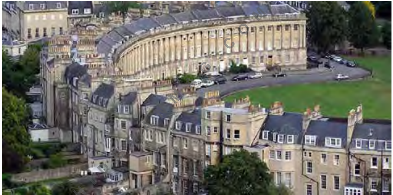
تصویر شماری ۴:

نمونه‌ای از اقدامات صورت گرفته‌ی گردشگری پس از ثبت شدن یک شهر در میراث جهانی یونسکو