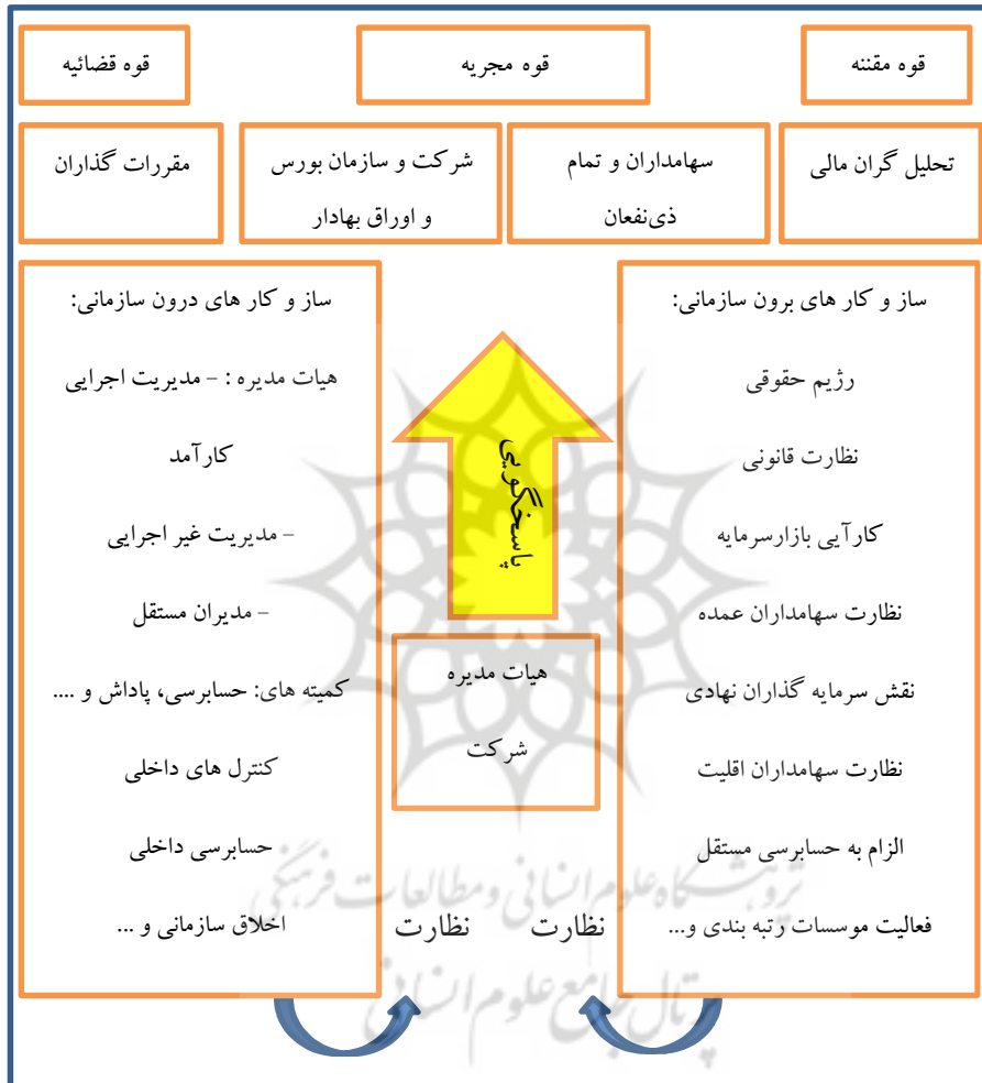
نمودار شماره ۱- ساختار حاکمیت شرڪتي

هر يك از آنها مي تواند دستيابي به اهداف حاكميت شرڪتي و گسترش بازار سرمايه را مختل و يا غير ممكن كند [6].