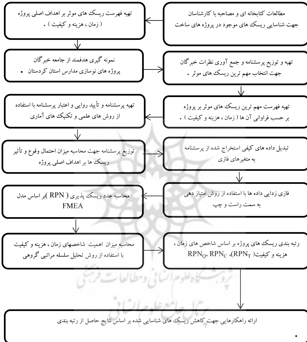
شکل ۱: مراحل انجام تحقیق