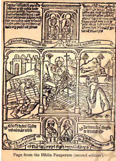
Page from the Biblia Pauperum (second edition).

سرزمین روم توسط امپراتور کنستانتین، آباء کلیسا به دلیل مخالفت با میراث تمدن یونان - روم با هنر و آثار هنری مخالف بودند و آن را ماترک دوران کفر می دانستند. تا آنجا که