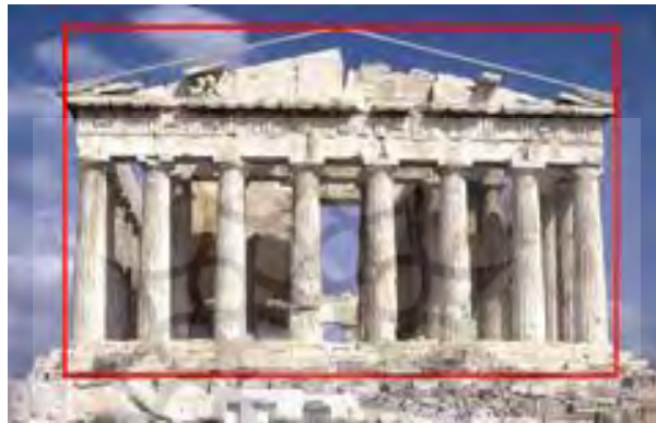
شکل ۶. پارتنون، آکروپولیس، آتن

باشد نقطه تفاوت آن با نسبی‌گرایی در دستگاه سیستمی است. به عبارت دیگر، هر نسبتی که بتواند مفهومی خاص یا پدیده‌ای خاص را به وجود آورد، فارغ از اینکه مفهوم سیستم برای آن تعمیم‌پذیر باشد یا نباشد، در حوزه نسبی‌گرایی آلومتری مطرح می‌شود. مثلاً، نسبت یا عدد طلایی - یعنی نسبت طول به عرضی که عدد ... 1.61803 را به وجود می‌آورد - تعریف‌کننده مفهوم زیبایی است. ۱ این نسبت برای هر شیء مانند انسان یا هر مفهوم دیگری مانند تعادل تعمیم‌پذیر است. شکل ۶ نسبت طلایی در معبد قدیمی پارتنون را، که با مستطیل طلایی متناسب است، نشان می‌دهد (آموتهینوا و رامون، ۲۰۱۳). بسیاری از هنرمندان بر آن‌اند که شکل‌هایی که در آن‌ها نسبت طلایی به کار رفته چشم‌نوازترین اشکال را پدید می‌آورد و مفهوم زیبایی به بیننده القا می‌شود.