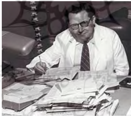
شکل ۵. لودویگ فون برتالنفی

لودویگ فون برتالنفی (۱۹۰۱ - ۱۹۷۲م) یکی از برجسته‌ترین زیست‌شناسان سده بیستم است. برتالنفی (شکل ۵) در زمینه علمی کارهای بسیار گوناگونی را دنبال کرد. شهرت وی به خاطر صورت‌دادن به «مفهوم ارگانیسمی» و همچنین بزرگ‌ترین دستاورد پژوهشی‌اش - تکامل مفهوم ارگانیسم به عنوان یک سیستم باز و تدوین طرح نظریه عمومی سیستم‌ها - بود که در گسترش زیست‌شناسی نظری نقش بزرگی ایفا کرد.