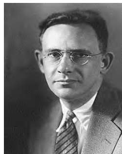
شکل ۲. ادوارد سایپیر

ادوارد سایپیر (۱۸۸۴ - ۱۹۳۹)، زبان‌شناس آلمانی، تحت تأثیر استادش، فرانس بواس ۱ ، به زبان‌شناسی عمومی روی آورد و به درجه دکتری در رشته مردم‌شناسی نائل آمد. مبدأ فرضیه نسبیت زبانی ۲ به آرای بواس، بنیان‌گذار مردم‌شناسی در امریکا، معطوف است. ادوارد سایپیر (شکل ۲) معتقد بود انسان‌ها از برخی لحاظ زندانی زبانشان‌اند. به باور او، نظر ما درباره واقعیت نسخه خلاصه‌شده‌ای از جهان است که زبان ما آن را ویرایش کرده است. وی معتقد بود جهان واقعی تا اندازه زیادی بر پایه عادت‌های زبانی هر گروهی ناآگاهانه بنا شده است. هیچ دو زبانی را نمی‌توان یافت که چنان شبیه هم باشند که تصور شود هر دو یک واقعیت اجتماعی را بازمی‌تابانند. جهان‌هایی که جامعه‌های متفاوت در آن‌ها زندگی می‌کنند در واقع جهان‌هایی متفاوت‌اند، نه آنکه جهان واحدی با برجسب‌های گوناگون باشند. به عبارت دیگر، انسان‌ها در جامعه‌های گوناگون واقعیت‌های متفاوتی را می‌بینند، زیرا به زبان‌های متفاوت سخن می‌گویند و هر زبانی واقعیت را در قالب جداگانه‌ای قالب‌ریزی می‌کند.