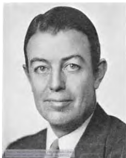
شکل ۳. بنجامین ورف