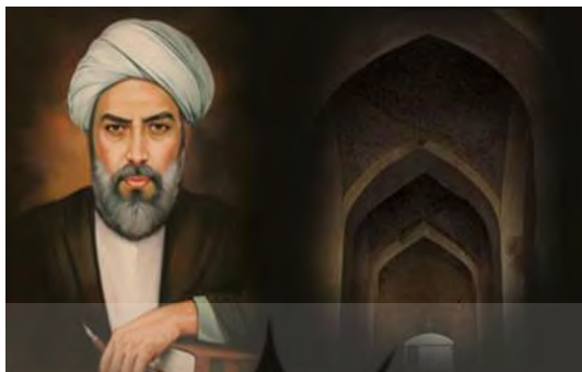
شکل ۷. ملاصدرا

صدرالدین محمد بن ابراهیم شیرازی (۹۷۹ - ۱۰۵۰ ق) ملقب به ملاصدرا و صدرالمتألهین (شکل ۷) در بیان نسبی‌گرایی آرای درخور تأملی دارد. وی در بزرگ‌ترین اثر خود، با نام الحکمه المتعالیه فی الاسفار العقلیه الاربعه ، معروف به اسفار ، مطالب خود را در چهار بخش به رشته تحریر درآورده است.