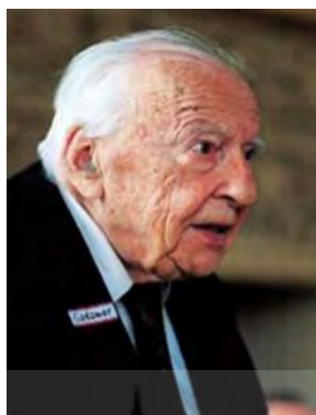
شکل ۱. هانس گئورگ گادامر

هرمنوتیک یا فلسفه هرمنوتیکی هستی‌شناسی فهم و ارمغان مارتین هیدگر (۱۹۲۷) است. هانس گادامر (شکل ۱) در پیروی از استادش، هیدگر، در حوزه هرمنوتیک، نخستین ثمر خویش را در کتاب مهم حقیقت و روش ظاهر ساخت. هانس گئورگ گادامر (۱۹۰۰ - ۲۰۰۲)، فیلسوف لهستانی اصل آلمانی، معروف‌ترین شاگرد هیدگر بود.