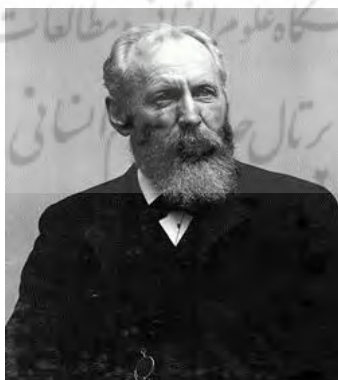
شکل ۹. جی. کارل. گیلبرت

در جغرافیا با ورود نگرش هارتشورن ۲ و جغرافیای ناحیه‌ای و سپس جغرافیای فضایی شیفر ۳ و تعبیر کروم ۴ ، فرانسوی‌ها نسبی‌گرایی را به طور عملی در تحلیل‌های جغرافیایی به کار بردند. بدیهی است به‌کارگیری هر یک از این دیدگاه‌ها موجب کاربرد روش‌های مخصوص به خود است. گوناگونی روش‌ها در تحلیل‌های جغرافیایی نیز از همین مسئله نشئت می‌گیرد. گیلبرت (شکل ۹) یکی از ژئومورفولوژیست‌های برجسته آمریکایی بود که بر تجزیه و تحلیل سیستم‌ها و زمینه فرایندهای ژئومورفولوژیکی تأکید داشت (سک ۵ ، ۱۹۹۲). گزارش زمین‌شناسی کوه‌های هنری (۱۸۷۷) وی به بررسی مکانیسم فرایندهای رودخانه‌ای اختصاص دارد. ارزش گزارش‌های علمی وی قبل از آنکه معطوف به نوشته‌های آن باشد بیشتر بر شهرت و نوآوری وی در روش پژوهش تأکید دارد. گیلبرت (۱۸۸۶، ۱۸۹۶) گفته‌های روشنی راجع به تصورش از روش علمی دارد. وی تعریف جدیدی از علم ارائه داد که با آنچه از مفهوم علم در عصر دیویس ۶ متداول بود تفاوت آشکاری داشت. به نظر وی، علم را نباید به شناخت ماهیت پدیده‌ها محدود کرد، بلکه علم دانش شناخت روابط بین پدیده‌هاست. این تعریف با آنچه برتالنفی در دیدگاه سیستمی به صورت تلویحی بعدها ارائه داد مشترک است. ولی در دنباله تعریف خود از علم به توضیحی می‌پردازد که تفاوت او را از برتالنفی نیز مشخص می‌کند.