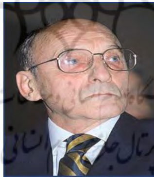
شکل ۸. ژرار ژنت

ژرار ژنت (۱۹۳۰) نظریه‌پرداز ادبی، ساختارگرا، منتقد، و یکی از تأثیرگذارترین پژوهشگران در عرصه بینامتنیت ۴ است. او واژه جدید و گسترده ترامتنیت ۵ را ابداع کرد.