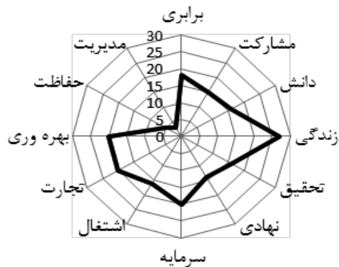
تصاویر ۱ و ۲: توزیع ده شاخص برابری