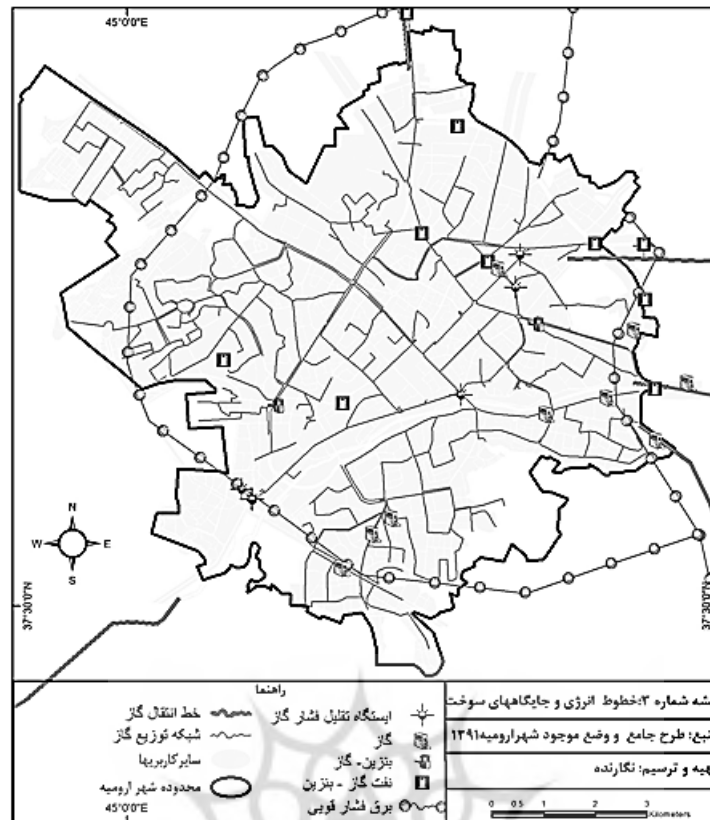
نقشه ۲. خطوط انرژی و جایگاه سوخت

پمپ‌های بنزین پتانسیل آسیب‌رسانی بالایی دارند و هنگام بحران احتمال خطر آن‌ها افزایش می‌یابد؛ بنابراین، همواره باید در انتخاب کاربری‌های همسایه آن‌ها دقت شود؛ زیرا در صورت ایجاد مشکل به نسبت فاصله با آن‌ها، طیف آسیب‌پذیری تغییر می‌کند (حبیبی و دیگران، ۱۳۹۲: ۸۵).