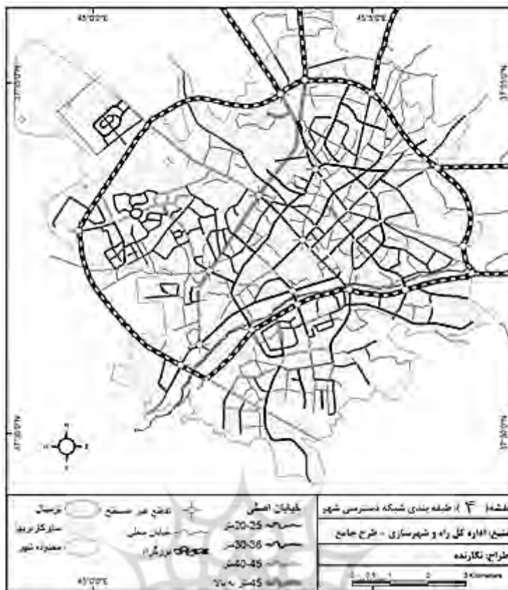
نقشه ۴. طبقه‌بندی شبکه دسترسی شهر