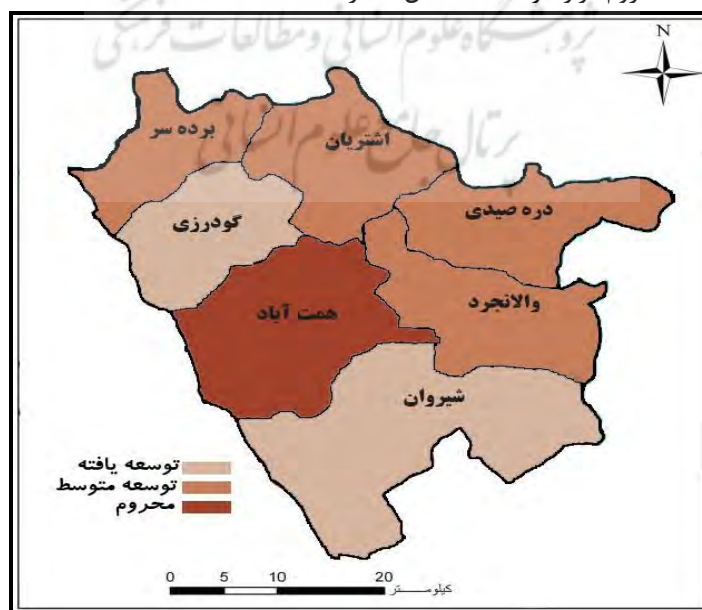
شکل ۳- سطح‌بندی توسعه دهستان‌های شهرستان بروجرد در شاخص آموزشی

نتایج حاصل از رتبه‌بندی دهستان‌های شهرستان بروجرد به لحاظ میزان توسعه روستایی در شاخص آموزشی، حاکی از آن است که طبق تکنیک ویکور فازی به ترتیب دهستان گودرزی (با ضریب ۰) دارای بالاترین رتبه و پس از آن دهستان‌های شیروان (با ضریب ۰/۰۲)، برده‌سر (با ضریب ۰/۳۷)، والانجرد (با ضریب ۰/۳۹)، اشترینان (با ضریب ۰/۴۵)، دره صیدی (با ضریب ۰/۴۶) و همت‌آباد (با ضریب ۱) به ترتیب در رتبه‌های دوم تا هفتم قرار دارند. نتایج حاصل از رتبه‌بندی دهستان‌های شهرستان بروجرد با استفاده از تکنیک تاپسیس فازی نیز نشان داد، در شاخص آموزشی دهستان گودرزی (با ضریب ۰/۴۱) دارای بیشترین میزان توسعه و پس از آن به ترتیب دهستان‌های شیروان (با ضریب ۰/۳۹)، برده‌سر (با ضریب ۰/۳۰)، والانجرد (با ضریب ۰/۲۹)، اشترینان (با ضریب ۰/۲۵)، همت‌آباد (با ضریب ۰/۲۵) و دره صیدی (با ضریب ۰/۲۴) قرار گرفته‌اند. در ادامه سطح‌بندی دهستان‌های شهرستان‌های بروجرد با استفاده از تکنیک تحلیل سلسله‌مراتبی خوشه‌ای نشان داد که تنها دهستان‌های گودرزی و شیروان در شاخص آموزشی توسعه‌یافته محسوب می‌گردد و ۵ دهستان این شهرستان در جرگه مناطق دارای توسعه متوسط تا محروم قرار گرفته‌اند. (شکل شماره ۳).