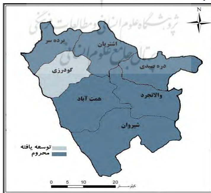
شکل ۴ - سطح‌بندی توسعه دهستان‌های شهرستان بروجرد در شاخص اداری - انتظامی

نتایج حاصل از رتبه‌بندی دهستان‌های شهرستان بروجرد به لحاظ میزان توسعه روستایی در شاخص اداری - انتظامی، نشان داد طبق تکنیک ویکور فازی به ترتیب دهستان گودرزی (با ضریب ۰) دارای بالاترین رتبه و پس از آن دهستان‌های اشترینان (با ضریب ۰/۷۲)، والانجرد (با ضریب ۰/۷۸)، دره‌صیدی (با ضریب ۰/۸۷)، شیروان (با ضریب ۰/۸۸)، همت‌آباد (با ضریب ۰/۹۵) و برده‌سر با ضریب (۱) به ترتیب در رتبه‌های دوم تا هفتم قرار دارند. نتایج حاصل از رتبه‌بندی دهستان‌های شهرستان بروجرد با استفاده از تکنیک تاپسیس فازی نیز نشان داد، در شاخص اداری - انتظامی دهستان گودرزی (با ضریب ۰/۵۵) دارای بیشترین میزان توسعه و پس از آن به ترتیب دهستان‌های اشترینان (با ضریب ۰/۳۷)، والانجرد (با ضریب ۰/۳۶)، شیروان (با ضریب ۰/۳۳)، همت‌آباد (با ضریب ۰/۳۳)، برده‌سر (با ضریب ۰/۳۰) و دره‌صیدی (با ضریب ۰/۳۰) قرار گرفته‌اند. سطح‌بندی دهستان‌های شهرستان‌های بروجرد با استفاده از تکنیک تحلیل سلسله‌مراتبی خوشه‌ای نیز نشان داد که تنها دهستان‌های گودرزی شاخص اداری - انتظامی توسعه‌یافته محسوب می‌گردد و ۶ دهستان این شهرستان در جرگه مناطق محروم قرار دارند. (شکل شماره ۴).