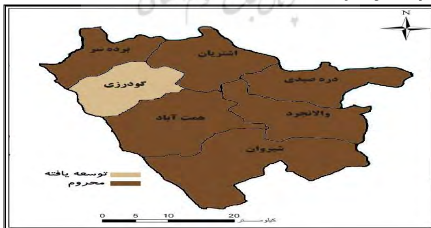
شکل ۵- سطح‌بندی توسعه دهستان‌های شهرستان بروجرد در شاخص بهداشتی - درمانی - منبع: یافته‌های تحقیق، ۱۳۹۶.

نتایج حاصل از رتبه‌بندی دهستان‌های شهرستان بروجرد به لحاظ میزان توسعه روستایی در شاخص بهداشتی - درمانی، نشان داد طبق تکنیک ویکور فازی به ترتیب دهستان گودرزی (با ضریب ۰) دارای بالاترین رتبه و پس از آن دهستان‌های برده‌سر (با ضریب ۰/۷۴)، اشترینان (با ضریب ۰/۷۷)، شیروان (با ضریب ۰/۸۹)، والانجرد (با ضریب ۰/۹۲)، دره‌صیدی (با ضریب ۰/۹۸) و همت‌آباد با ضریب (۱) به ترتیب در رتبه‌های بعدی قرار دارند. نتایج حاصل از رتبه‌بندی دهستان‌های شهرستان بروجرد با بهره‌گیری از تکنیک تاپسیس فازی نیز نشان داد، در شاخص بهداشتی - درمانی دهستان گودرزی (با ضریب ۰/۴۴) دارای بیشترین میزان توسعه و پس از آن به ترتیب دهستان‌های برده‌سر (با ضریب ۰/۳۴)، اشترینان (با ضریب ۰/۳۳)، شیروان (با ضریب ۰/۲۷)، والانجرد (با ضریب ۰/۲۵)، دره‌صیدی (با ضریب ۰/۲۵) و همت‌آباد (با ضریب ۰/۲۰) قرار گرفته‌اند. در ادامه سطح‌بندی دهستان‌های شهرستان‌های بروجرد با استفاده از تکنیک تحلیل سلسله‌مراتبی خوشه‌ای نشان داد که تنها دهستان‌های گودرزی شاخص بهداشتی - درمانی توسعه‌یافته محسوب می‌گردد و ۶ دهستان این شهرستان در زمره مناطق محروم قرار دارند. (شکل شماره ۵).