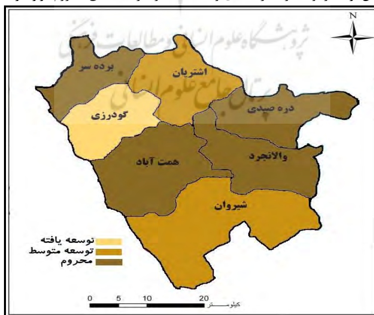
شکل ۶- سطح‌بندی توسعه دهستان‌های شهرستان بروجرد در شاخص ارتباطی

نتایج حاصل از رتبه‌بندی دهستان‌های شهرستان بروجرد به لحاظ میزان توسعه روستایی در شاخص ارتباطی، حاکی از آن است که طبق تکنیک ویکور فازی به ترتیب دهستان گودرزی (با ضریب ۰) دارای بالاترین رتبه و پس از آن دهستان‌های شیروان (با ضریب ۰/۴۷)، اشترینان (با ضریب ۰/۵۰)، برده‌سر (با ضریب ۰/۸۵)، والانجرد (با ضریب ۰/۸۹)، دره صیدی (با ضریب ۰/۹۸) و همت‌آباد با ضریب (۱) به ترتیب در رتبه‌های دوم تا هفتم قرار دارند. نتایج حاصل از رتبه‌بندی دهستان‌های شهرستان بروجرد با استفاده از تکنیک تاپسیس فازی نیز نشان داد، در شاخص ارتباطی دهستان گودرزی (با ضریب ۰/۵۰) دارای بیشترین میزان توسعه و پس از آن به ترتیب دهستان‌های اشترینان (با ضریب ۰/۴۰)، برده‌سر (با ضریب ۰/۳۴)، شیروان (با ضریب ۰/۳۰)، والانجرد (با ضریب ۰/۳۰)، دره صیدی (با ضریب ۰/۲۵) و همت‌آباد (با ضریب ۰/۲۲) قرار گرفته‌اند. سطح‌بندی دهستان‌های شهرستان‌های بروجرد با استفاده از تکنیک تحلیل سلسله‌مراتبی خوشه‌ای نیز نشان داد که تنها دهستان گودرزی در شاخص ارتباطی توسعه‌یافته محسوب می‌گردد و ۲ دهستان اشترینان و شیروان در رده مناطق دارای توسعه متوسط و ۴ دهستان برده‌سر، والانجرد، دره صیدی و همت‌آباد در جرگه مناطق محروم قرار دارند. (شکل شماره ۶).