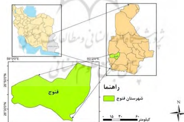
شکل (۱) نقشه راهنمای منطقه مورد مطالعه، نگارندگان، ۱۳۹۳

شهر فنوج در حدود مختصات جغرافیایی طول ۲۶ درجه و ۳۴ دقیقه شمالی و عرض ۵۹ درجه و ۳۸ دقیقه شرقی، در شمال غرب شهرستان نیکشهر و در جنوب استان سیستان و بلوچستان استقرار یافته است. طبق آخرین تقسیمات شکل (۱) موقعیت استقرار شهر فنوج در استان نشان داده شده است.