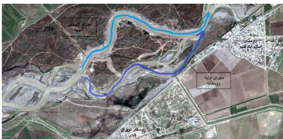
شکل ۵- انتقال مجرای رودخانه ارس در بازه توپراق کندی توسط شرکت آب منطقه‌ای استان اردبیل

باعث شده که در این بازه از سال ۱۹۸۷ تا ۲۰۱۴ حدود ۱۳۰ هکتار به زمین‌های ساحلی ایران افزوده شود که این رقم بسیار بزرگی بوده و اهمیت اقدامات حفاظتی مثبت شرکت آب منطقه‌ای استان اردبیل را نشان می‌دهد. باید اشاره کرد که در این بازه جهت جلوگیری از جابجایی‌های عرضی رودخانه ارس دایک توپراق کندی با پوشش ریپ ریپ احداث گردیده است که این اقدامات چنان چه در شکل ۵ نیز نشان داده شده، عملیات بسیار موفقی در جهت اصلاح و سامان‌دهی مجرای رودخانه ارس بوده است. این بازه اصلاحی در ترانسکت ۹ قرار گرفته است.