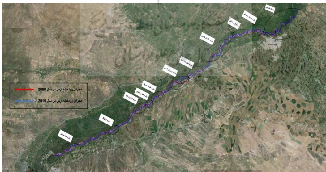
شکل ۴- موقعیت بازه‌های اصلاحی مسیر رودخانه ارس

اصلاح و ساماندهی مسیر رودخانه ارس در منطقه مورد مطالعه (از اصلاندوز تا پارس‌آباد) در ۱۱ بازه مختلف توسط شرکت آب منطقه‌ای استان اردبیل صورت گرفته است. این اقدامات در بازه‌هایی با نام‌های: دایک قدیمی، بازه محمد رضالو، بازه قره داغلو، بازه سلمان کندی، بازه علیرضا آباد، بازه توپراق کندی، بازه غرب سریند، بازه حاج حسن کندی، بازه اوزون تپه، بازه ۵۳/۱، بازه مقصودلو نقش بسیار مهمی در اصلاح مسیر رودخانه و جلوگیری از جابجایی‌های عرضی رودخانه ارس در طی سال‌های گذشته داشته است.