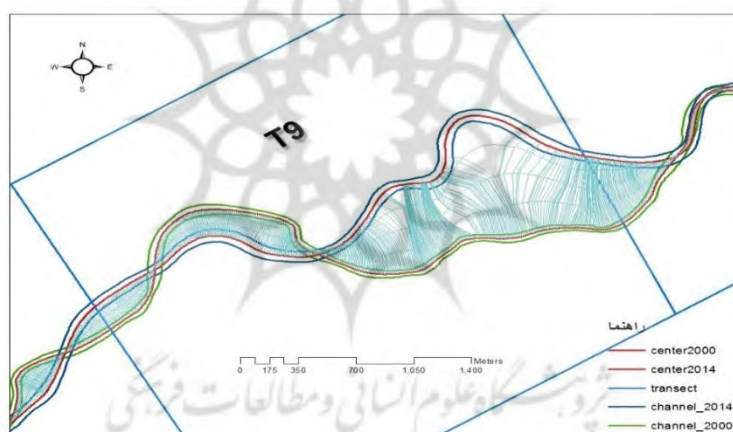
شکل ۳- روش محاسبه میزان جابجایی عرضی مجرا (ترانسکت ۹، مجاورت روستای توپراق کندی)

در منطقه مورد مطالعه، تغییرات مجرا با توجه به روند گذشته به سه دلیل عمده اتفاق افتاده است: ۱- مهاجرت مجرا در دشت سیلابی بواسطه فرسایش کناره مقعر حلقه‌های مئاندرها که با توجه به شرایط محلی از شدت و ضعف برخوردار بوده است، ۲- ایجاد میان‌بُرها بواسطه پیشروی و نزدیک شدن پایه مئاندرها، که آثار آن به صورت مجراهای متروک قابل مشاهده می‌باشد و ۳ - تغییر مسیر ۲ بخشی از مجرای رودخانه که به عنوان نمونه می‌توان به ترانسکت ۹ اشاره کرد که یک تغییر مسیر به طول حدوداً ۲ کیلومتر در آن دیده می‌شود. در واقع، مقادیر زیاد و