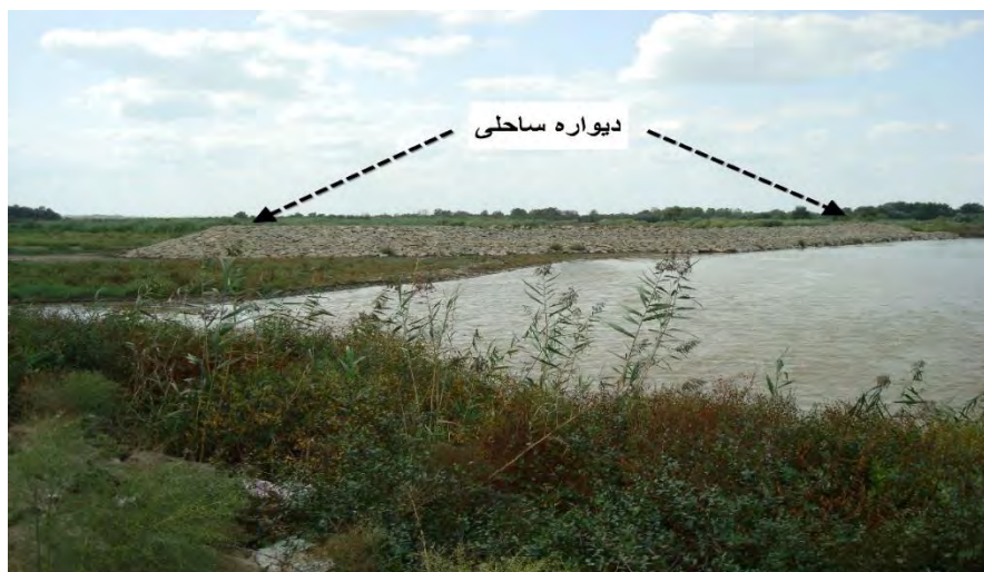
شکل ۷- نمونه‌ای از دیوار ساحلی حفاظتی ساخته شده توسط شرکت آب منطقه‌ای استان اردبیل در بازه محمد رضالو

در این مناطق مسیر جریان اصلاح گردیده است. واضح است که در اثر تغییر مسیر رودخانه، پارامترهای ریخت شناسی رودخانه نیز دستخوش تغییر می‌گردد. در صورتی که با اصلاح مسیر رودخانه، طول رود کاهش یابد، شیب طولی رودخانه افزایش خواهد یافت. این تغییر سبب می‌شود که مسیر لایروبی دچار کف کنی و فرسایش در کناره‌ها گردد. این امر تا زمانی که رودخانه به شیب قبلی خود برسد ادامه خواهد داشت. اگر با ایجاد مجرای لایروبی، طول مسیر جریان افزایش یابد، شیب طولی کاهش یافته و سرعت تنش برشی نیز کم می‌گردد. این امر موجب رسوب‌گذاری در مجرای لایروبی شده و به تدریج با بالا آمدن بستر رودخانه، شیب مجرای لایروبی به شیب قبلی خود متمایل می‌گردد. گذشته از این، در پایین دست مجرای لایروبی و در جایی که کانال لایروبی و رودخانه ارس یکی شوند نیز باید تمهیدات خاصی جهت مقابله با برخورد مستقیم جریان آب به ساحل ایران اندیشیده شود. در غیر این صورت، آثار فرسایش و ایجاد ترانشه عمودی در پایین دست بازه لایروبی اجتناب پذیر خواهد بود. (مهندسین مشاور یکم، ۱۳۹۴: ۵۳)