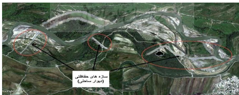
شکل ۶- سازه‌های احداثی (دیوار ساحلی) در ساحل راست ارس در بازه اصلاحی محمدرضالو

در بازه محمد رضالو طی اجرای طرح ساماندهی رودخانه ارس با احداث دیوار ساحلی، نزدیک ۱۴۰ هکتار بر زمین‌های ساحلی ایران افزوده شده است. این اقدامات اصلاح مسیر رودخانه، نقش بسیار خوبی در کاهش جابجایی‌های عرضی رودخانه ارس داشته است. نمونه‌ای از این دیوارهای ساحلی حفاظتی جهت اصلاح مسیر رودخانه در بازه محمدرضالو در شکل ۶ نشان داده شده است.