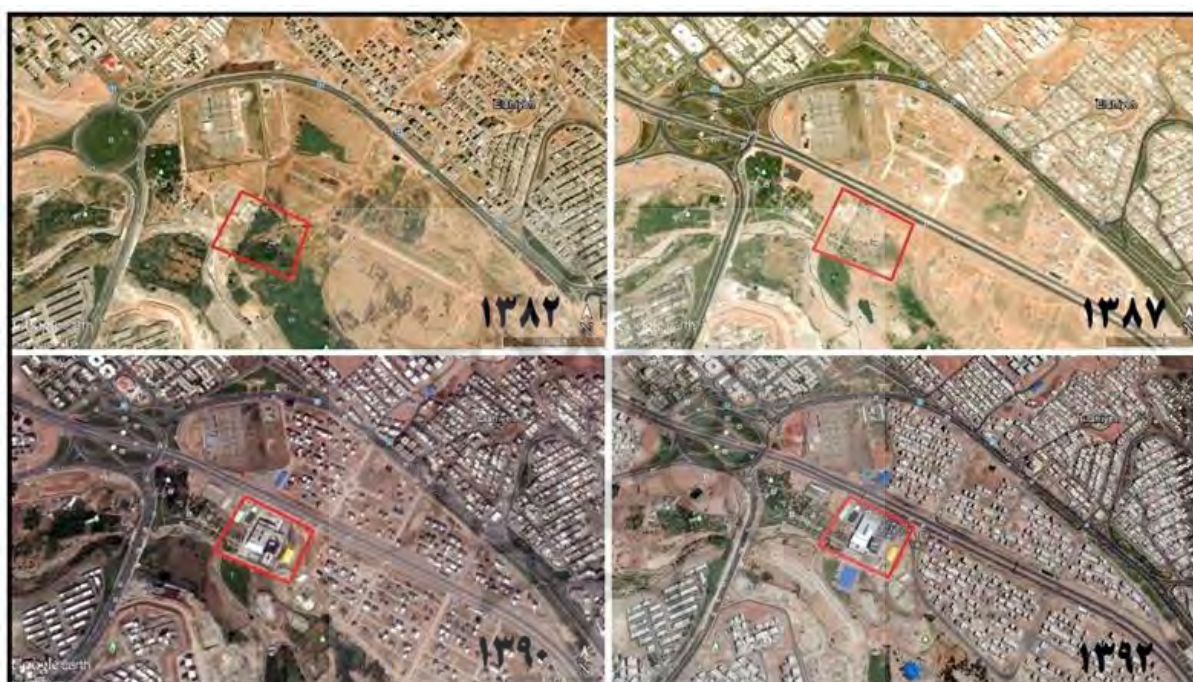
شکل ۳. روند توسعه فضاهای اطراف مجتمع تجاری لاله پارک

همان‌طور که شکل ۳، نشان می‌دهد، توجه به روند ساخت و ساز در این منطقه در گذر زمان، حاکی از وجود فضاهای خالی اطراف مجتمع لاله‌پارک در سال ۱۳۸۲ و فقدان هرگونه ساخت و ساز در منطقه می‌باشد. اما چند سال پس از احداث مجتمع تجاری و بهره‌برداری به تدریج ساخت و ساز آغاز شده و روند صعودی به خود می‌گیرد. این روند با پایش تصاویر ماهواره‌ای سال‌های ۱۳۸۳ الی ۱۳۹۰، شکل ۳، قابل ملاحظه می‌باشد.