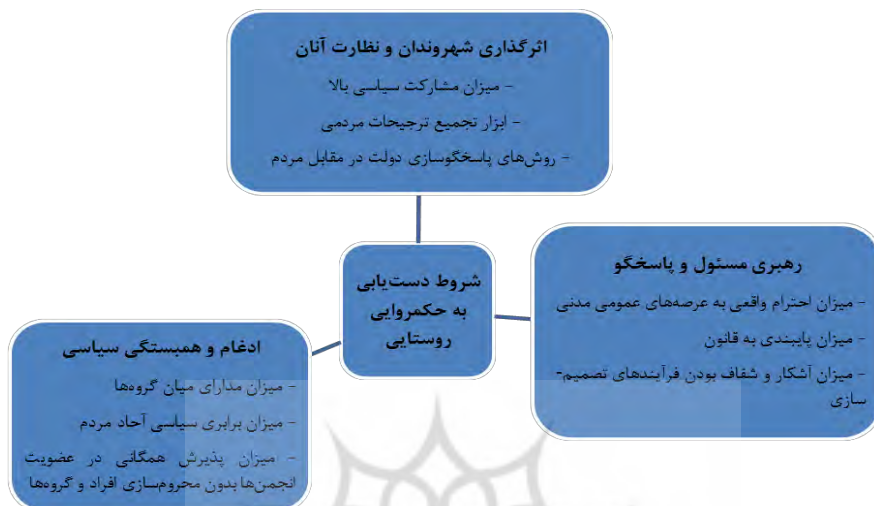
شکل ۲- شروط دست‌یابی به حکمروایی روستایی

رکن‌الدین افتخاری و همکاران، ۱۳۹۱، ص. ۱۶). شایان ذکر است هرکدام از این شاخص‌ها دربرگیرنده متغیرهای متعددی هستند و در مجموع، دربرگیرنده کلیه ابعاد حکمروایی خوب در نواحی روستایی ایران هستند. شروط دست‌یابی به حکمروایی