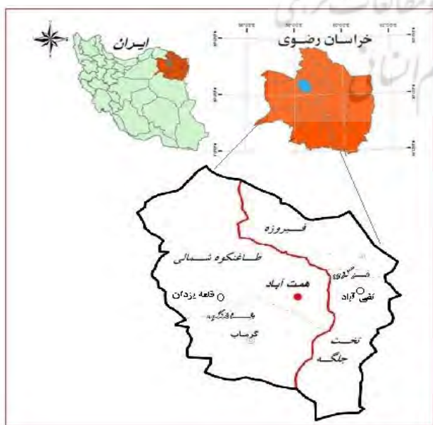
شکل ۱- موقعیت منطقه مورد مطالعه

باغ نشاط به عنوان یکی از بزرگ‌ترین باغ‌های ایرانی کشور، از آثار تاریخی روستای تقی‌آباد بخش مرکزی شهرستان فیروزه است که متعلق به اواخر دوره قاجار و اوایل حکومت پهلوی اول می‌باشد. روستای تقی‌آباد که این اثر فاخر تاریخی در آن واقع شده، در ۳ کیلومتری شمال شهر فیروزه (۱۸ کیلومتری شهر نیشابور) قرار گرفته است. این روستا براساس سرشماری سال ۱۳۹۰ دارای ۲۳۳ خانوار و ۷۸۰ نفر جمعیت است. «آقابالاخان سالار معتمد گنجی» یکی از خوانین بزرگ خراسان در اواخر حکومت قاجار، در زمان جنگ جهانی اول (حدود ۱۳۳۶ ه. ق) زمین غیرقابل کشتی را به باغ تبدیل کرد و نام آن را «نشاط» گذاشت. باغ نشاط دارای ۱۶ هکتار مساحت، کوشک میانی و کوشک شمالی، برج و بارو و حصار و درختان سر به فلک کشیده و غیره است. این اثر تاریخی و طبیعی که به دلایل مختلف از سال‌های دهه ۶۰ شمسی رو به ویرانی نهاده بود، خوش‌بختانه از تابستان سال ۱۳۹۱ توسط اداره میراث فرهنگی صنایع دستی و گردشگری شهرستان فیروزه و حمایت‌های سایر ارگان‌ها و اهالی روستا مرمت و احیا شد.