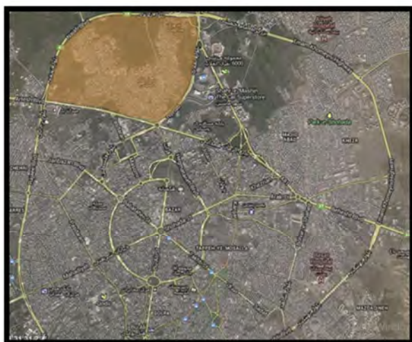
تصویر ۱. موقعیت محله حصار