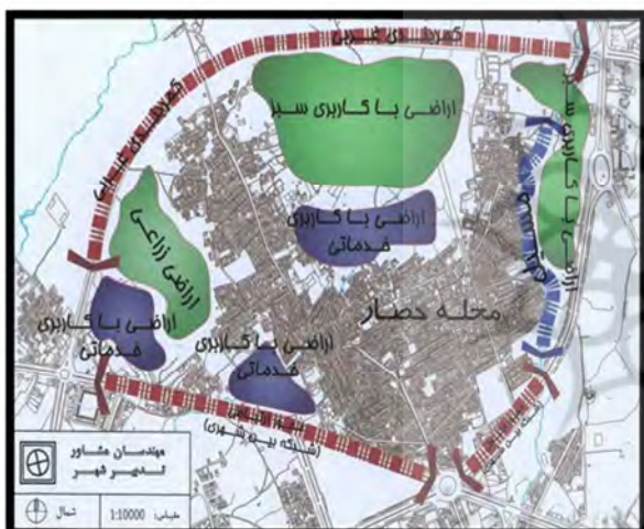
تصویر ۲. وضعیت محله حصار